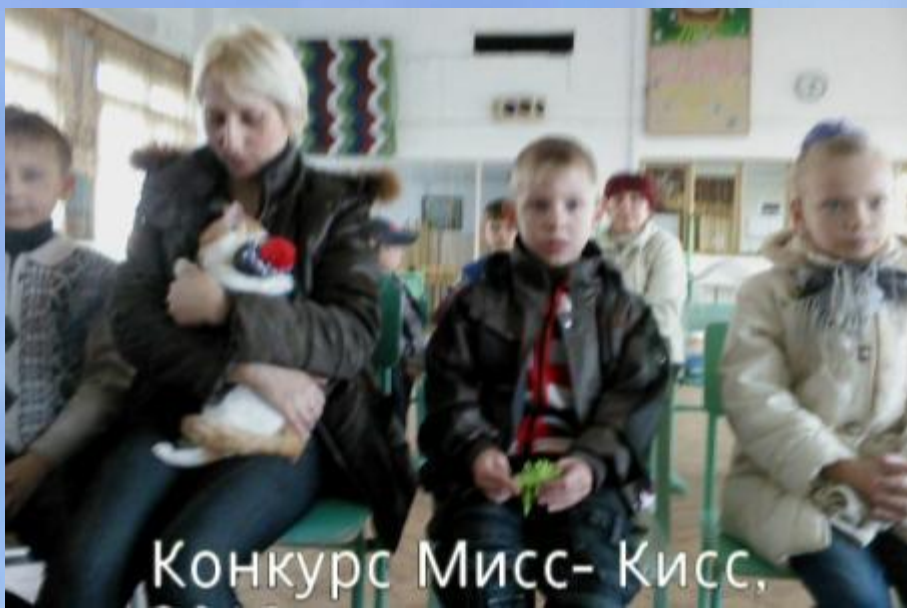
Конкурс Мисс- Кисс,

Мы стараемся привлечь внимание родителей к работе над проектами. Именно родители помогают оформить проект и подготовить его презентацию.