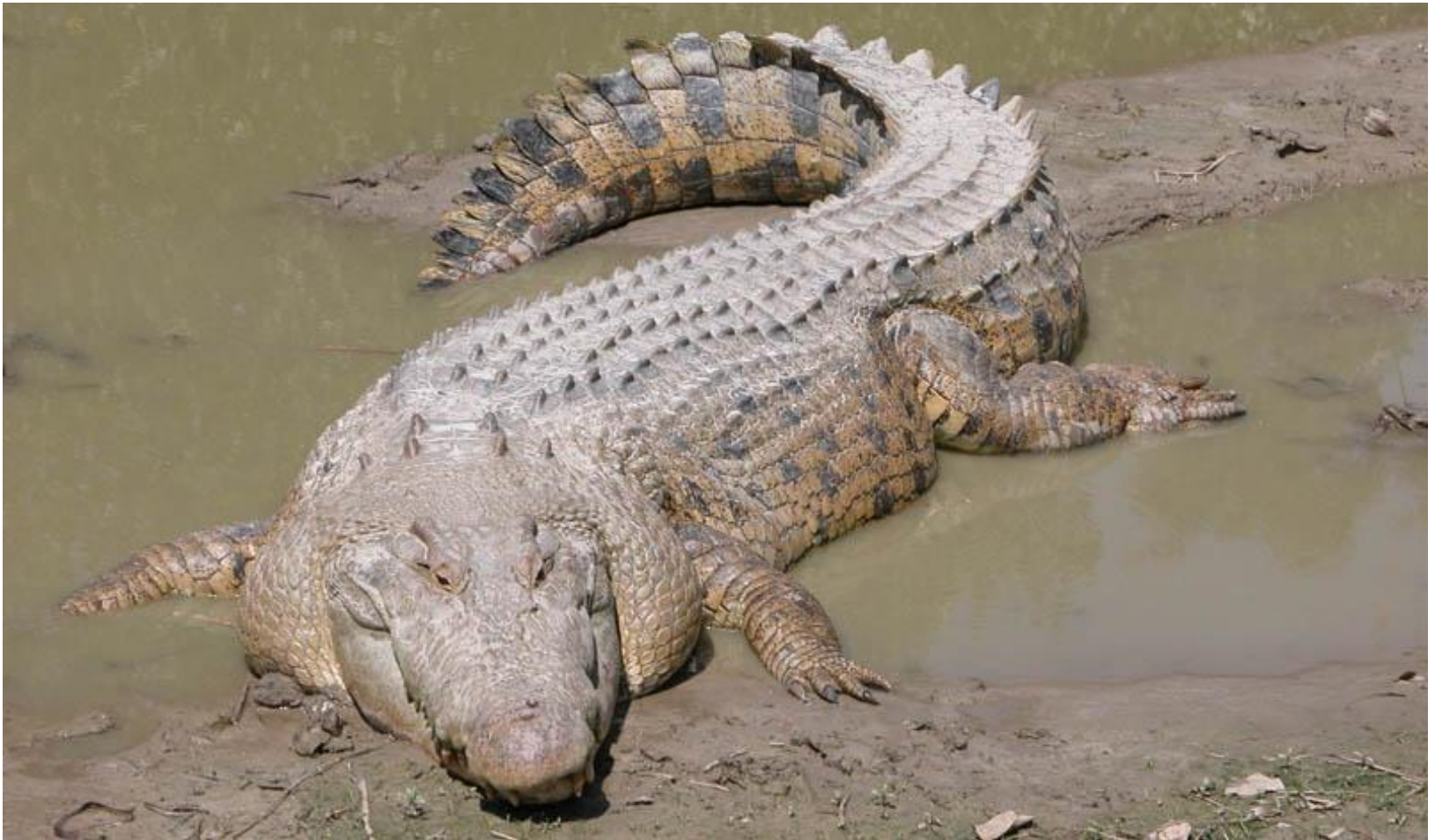
Морской (гребнистый или ноздреватый) крокодил Длина 5 метров, вес 1150 кг