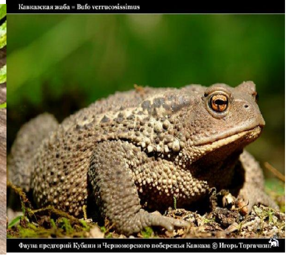
Кавказская жаба - Bufo verrucosissimus