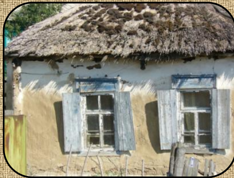
Мазанка с соломенной крышей