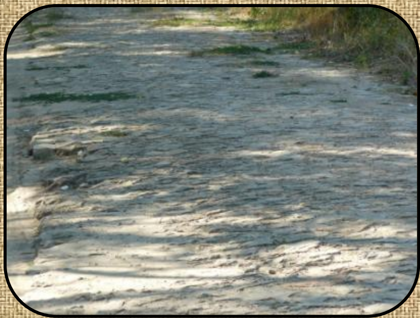
Старая каменная дорога