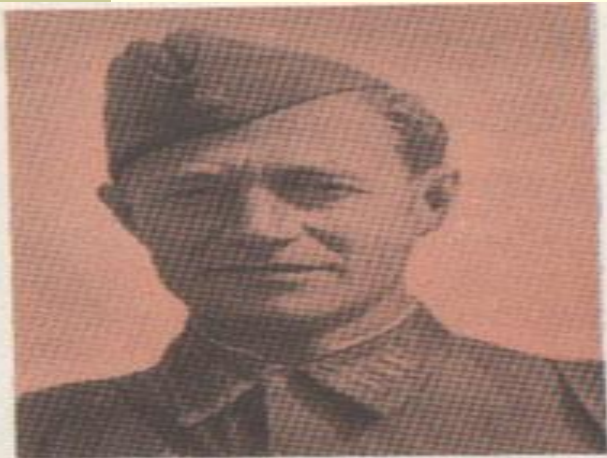
А. А. Сурков. Фото военных лет.