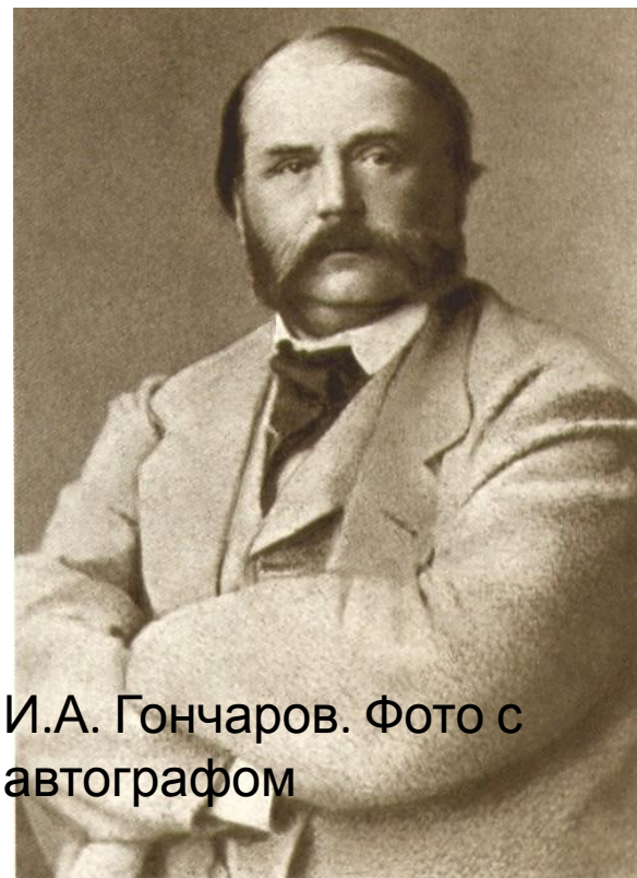
И.А. Гончаров. Фото с автографом