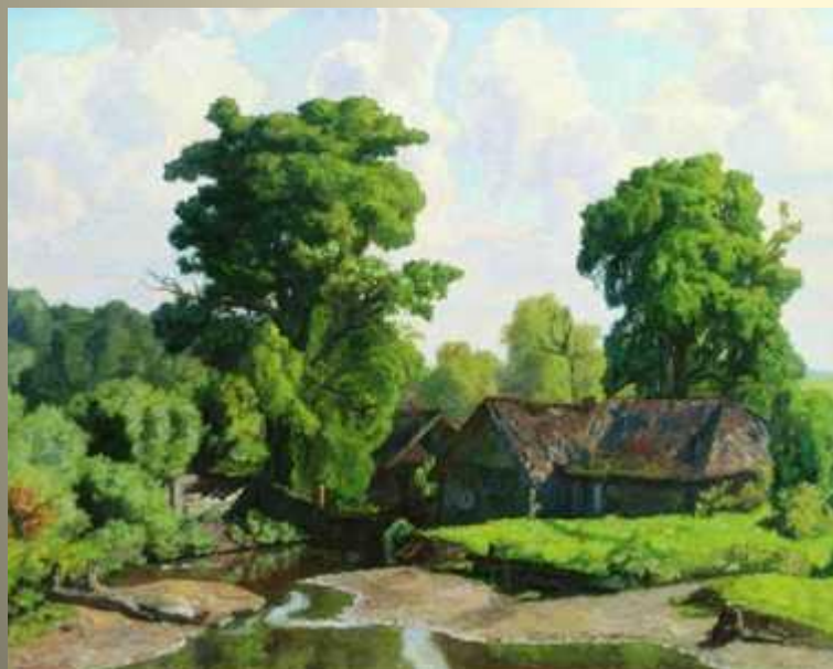
Н.П.Крымов «У мельницы»