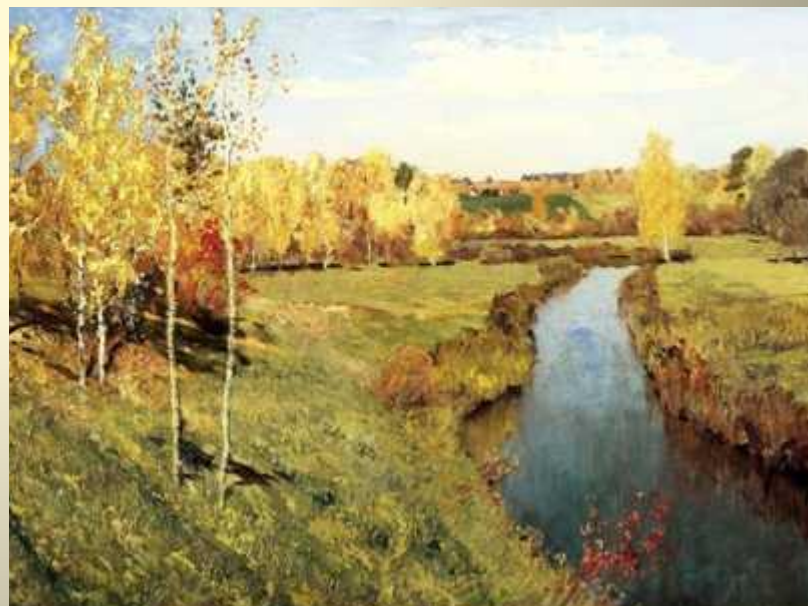
И.И.Левитан «Золотая осень»