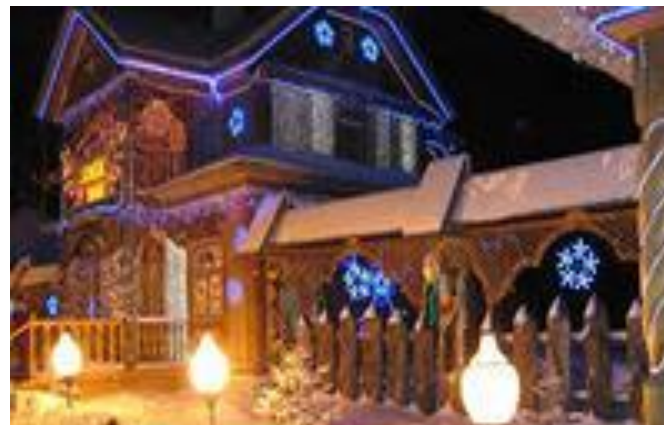
Беловежская пуща – Резиденция Деда Мороза