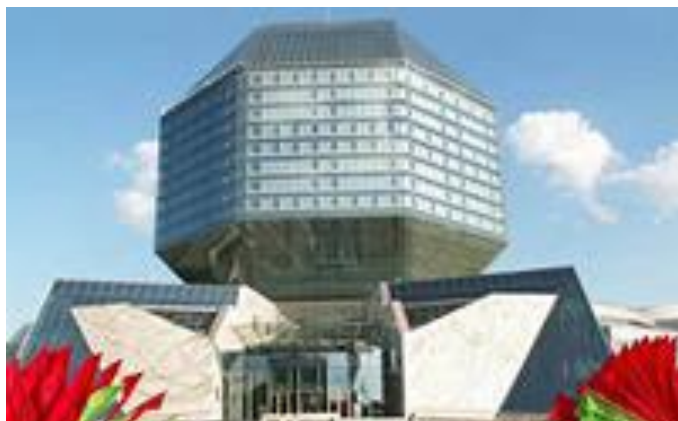
Здание национальной Библиотеки