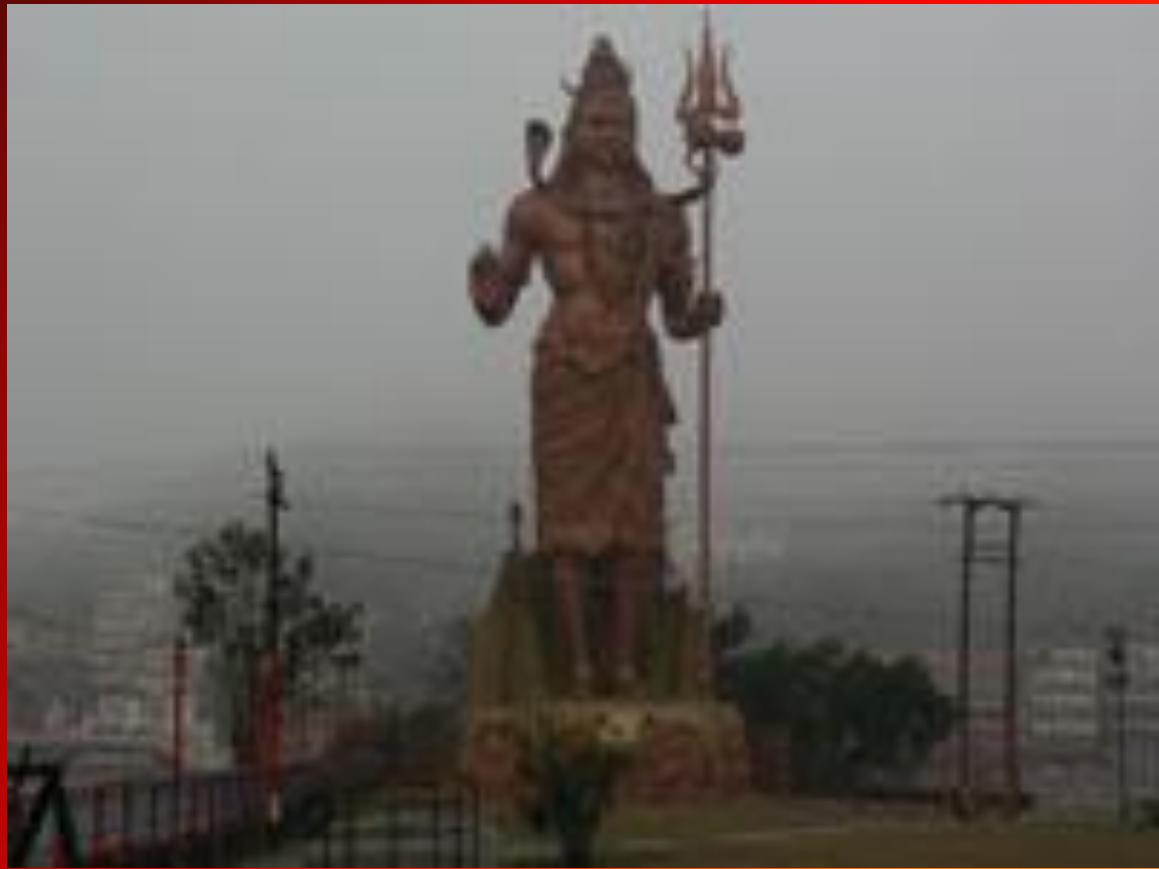
Храм Шри Шивы в Харидваре

В период с начала 18 века по середину 20 века Индия была постепенно колонизирована Британской империей. Получив независимость в 1947 году,