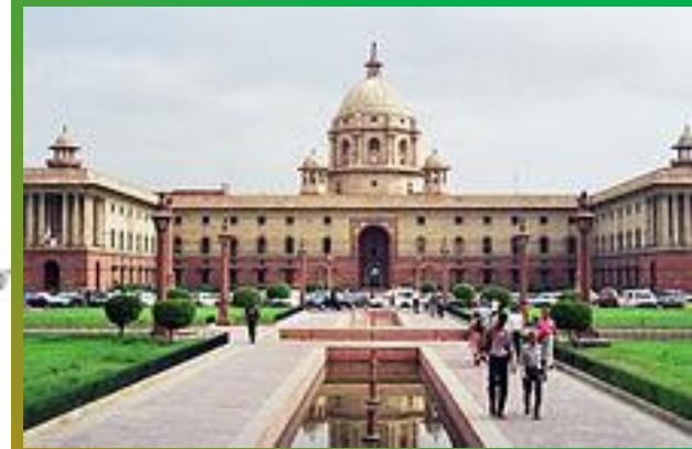
Столица Индии Дели