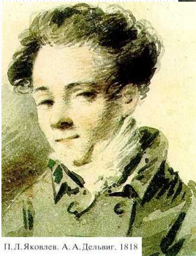
П. Л. Яковлев. А. А. Дельвиг. 1818