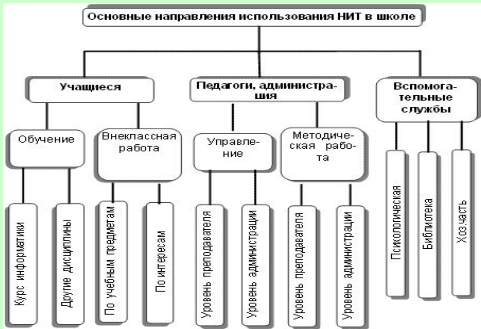
Схема комплексного подхода внедрения ИТ в образовательный процесс.