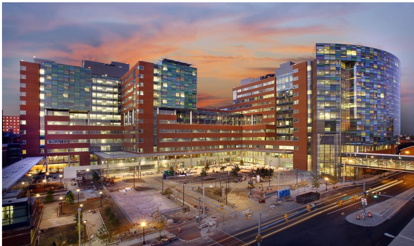
Госпиталь Джона Уодкинса

Елде 1100 стационар бар. 375 ірі мекеме Американдық медициналық колледждер қауымдастығының (American Medical Colleges Council of Hospitals and Health Systems (COTH) оқыту жөніндегі ағылшын қауымдастығы) ауруханалық жаттықтырушылар кеңесінің құрамына кіреді. COTH ауруханалары елдегі аурухана қайырымдылықтарының шамамен 40% құрайды