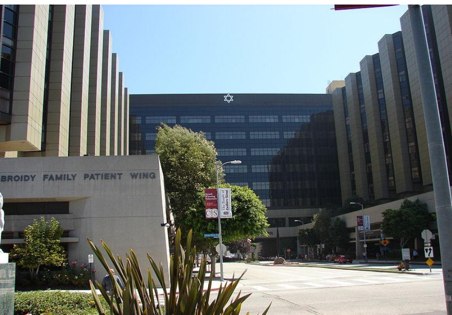
«Бесприбыльный» медицинский центр Седарс-Синай