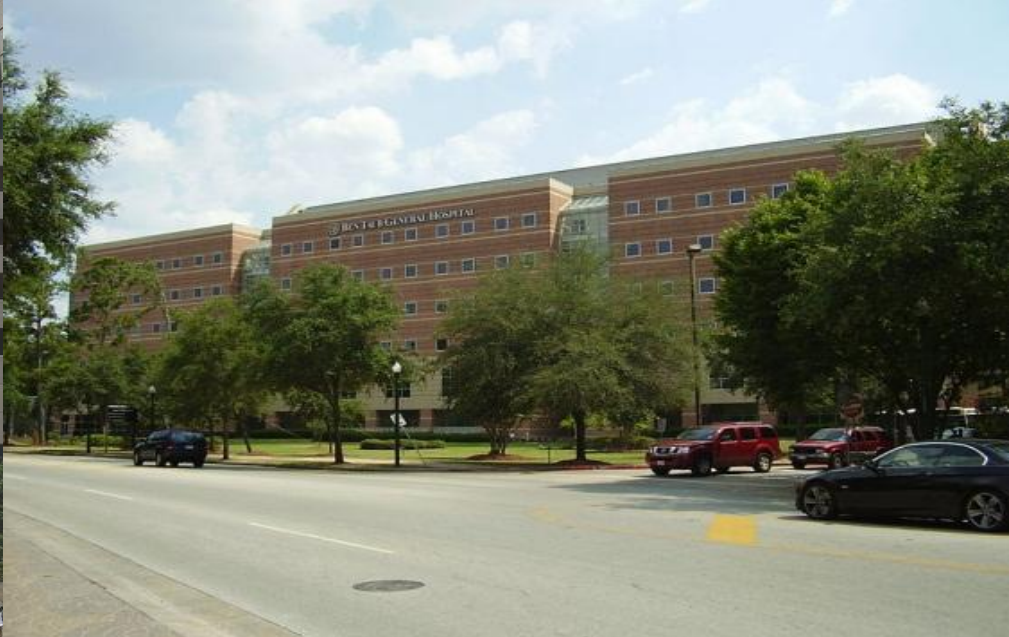
Государственная больница «Бен Тауб Дженерал», Хьюстон .