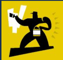
работа и услуги

то, на что направлена деятельность участников правоотношения