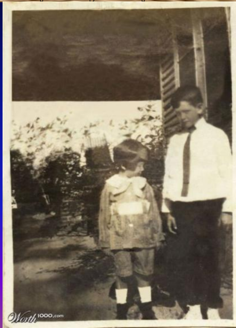
ФОТО ПО КОТОРОМУ НАРИСОВАНА КАРТИНА