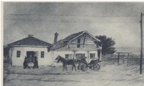
В. Г. Короленко.