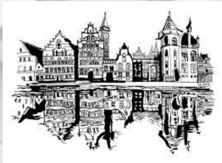
Рисунок является основой всех видов графики и других видов изобразительного искусства.

Рисунок относится к уникальной графике потому, что каждый рисунок является единственным в своем роде.