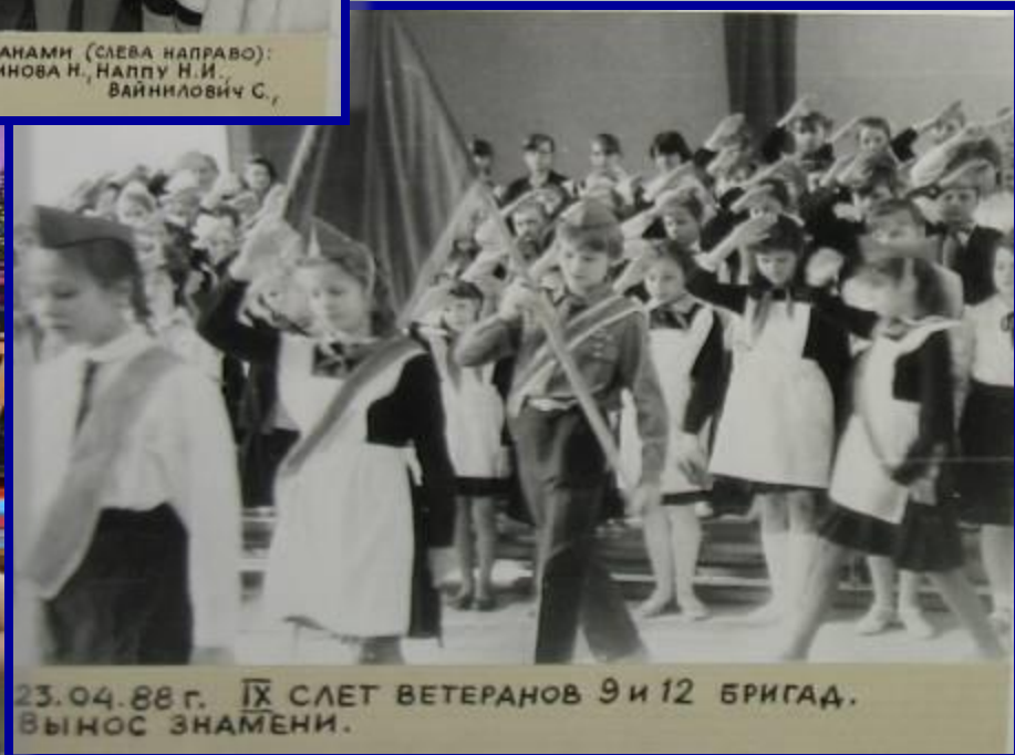
23.04.88 г. IX СЛЕТ ВЕТЕРАНОВ 9 И 12 БРИГАД. ВЫНОС ЗНАМЕНИ.