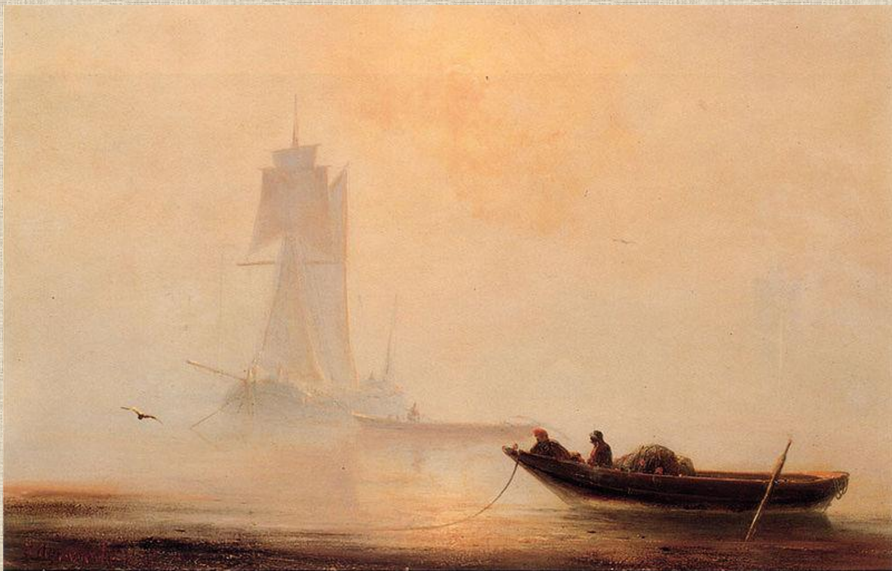
И.К. Айвазовский . Рыболовное судно в гавани