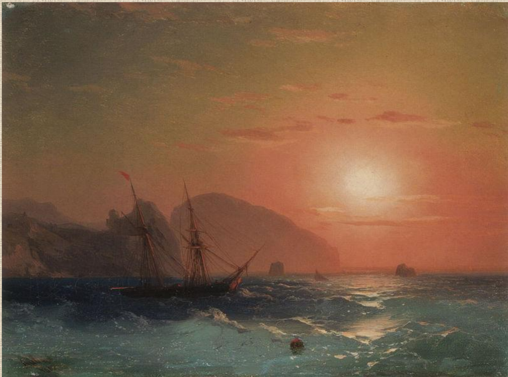
И.К. Айвазовский. Вид на Аю Даг.