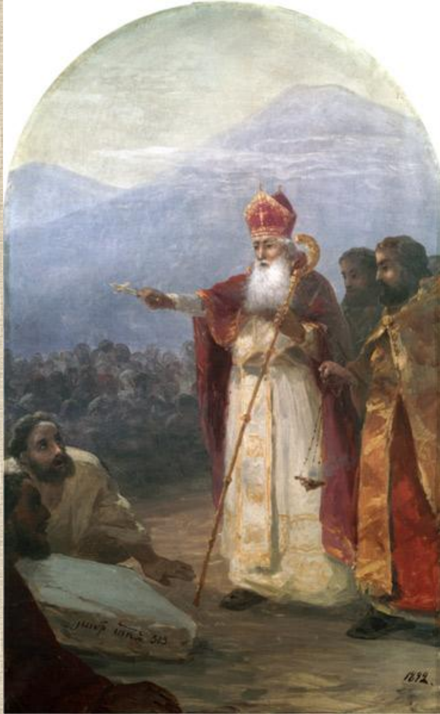
И.К. Айвазовский. Крещение армянского народа. Григорий Просветитель.