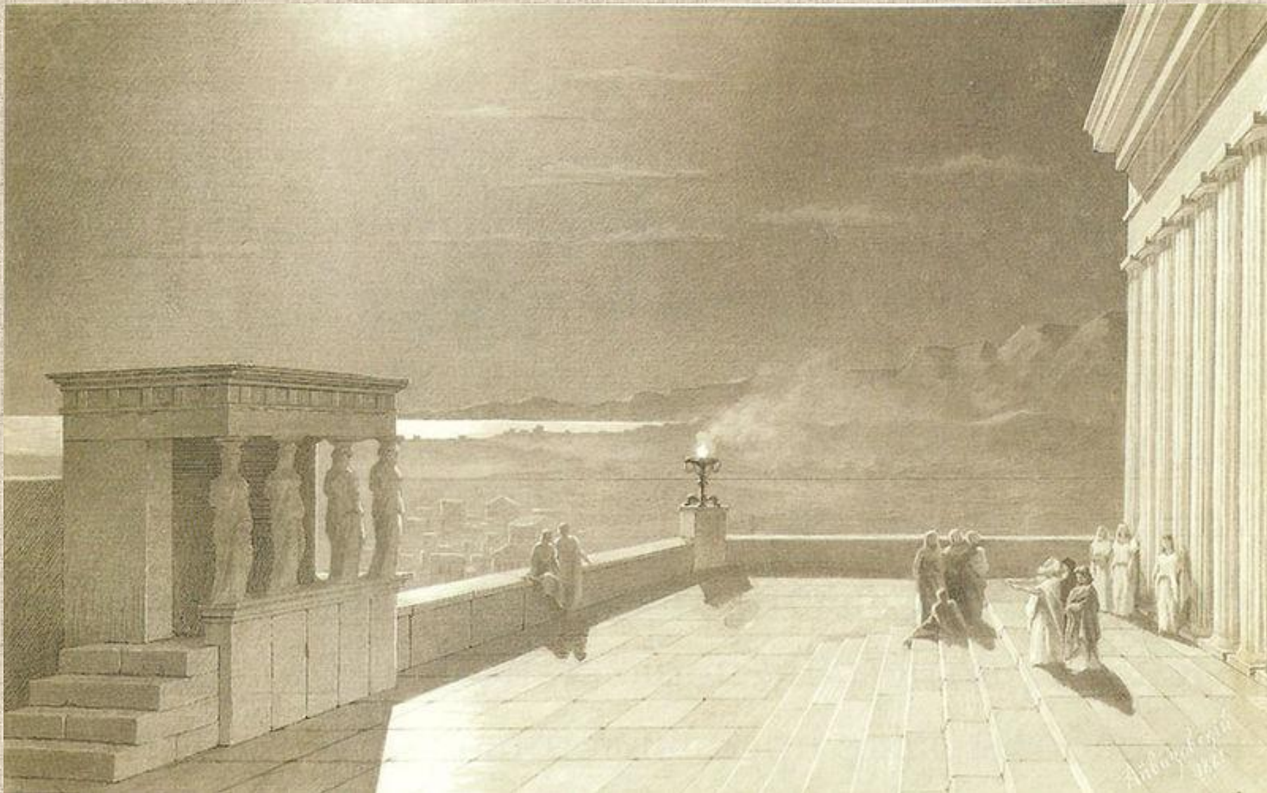
И.К. Айвазовский. Акрополь в Афинах в лунную ночь.