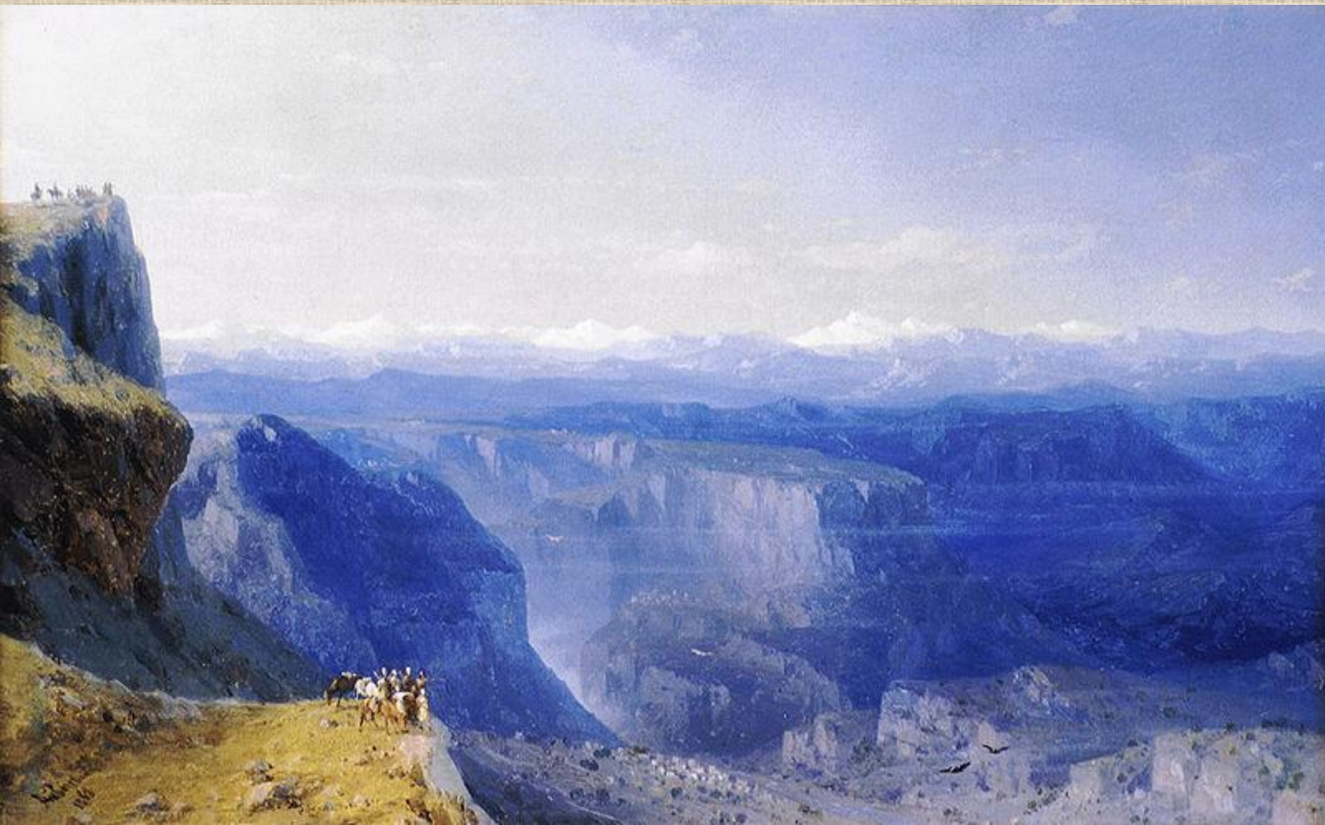
И.К. Айвазовский . Кавказ.