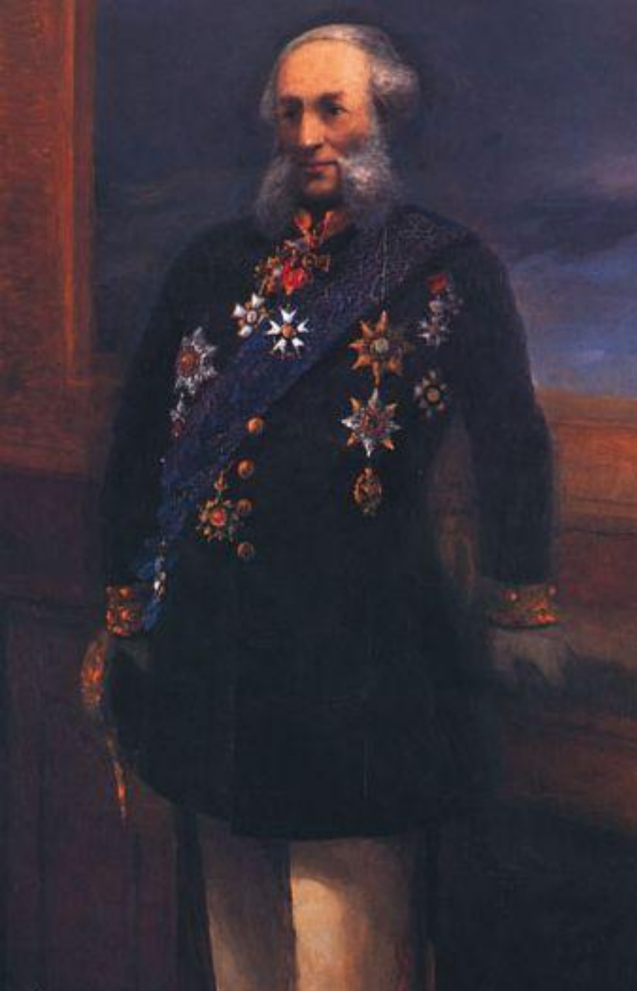
И.К. Айвазовский. Автопортрет.