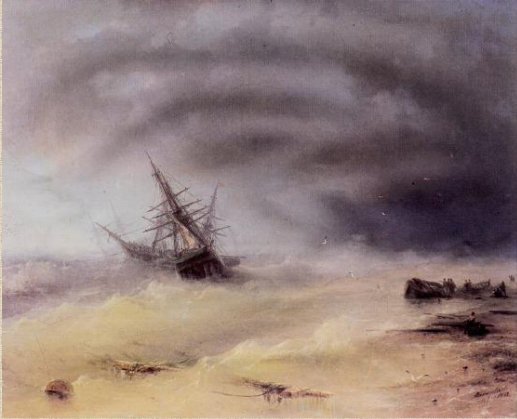
И.К. Айвазовский. Шторм.