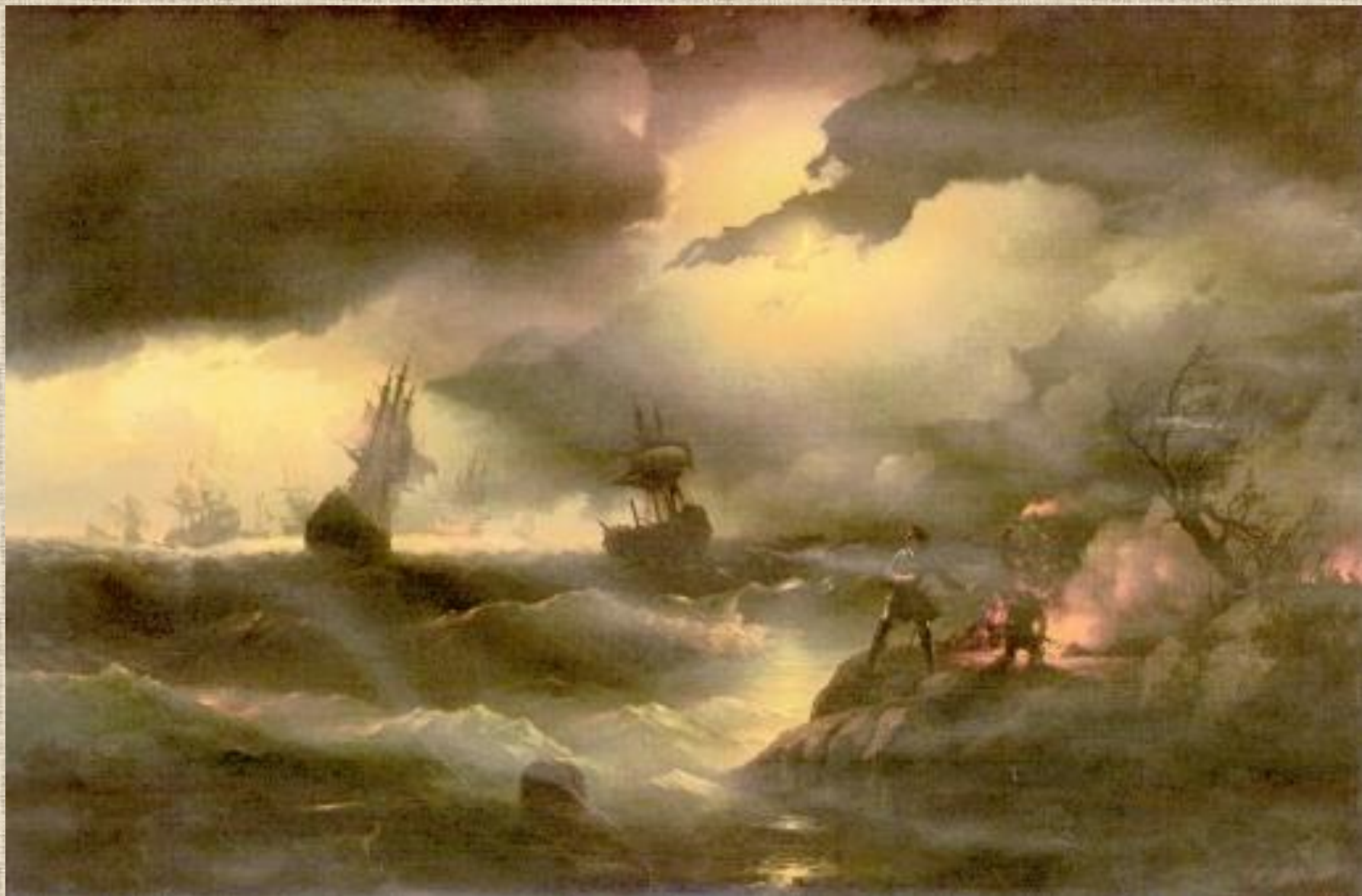
И.К. Айвазовский . Петер.