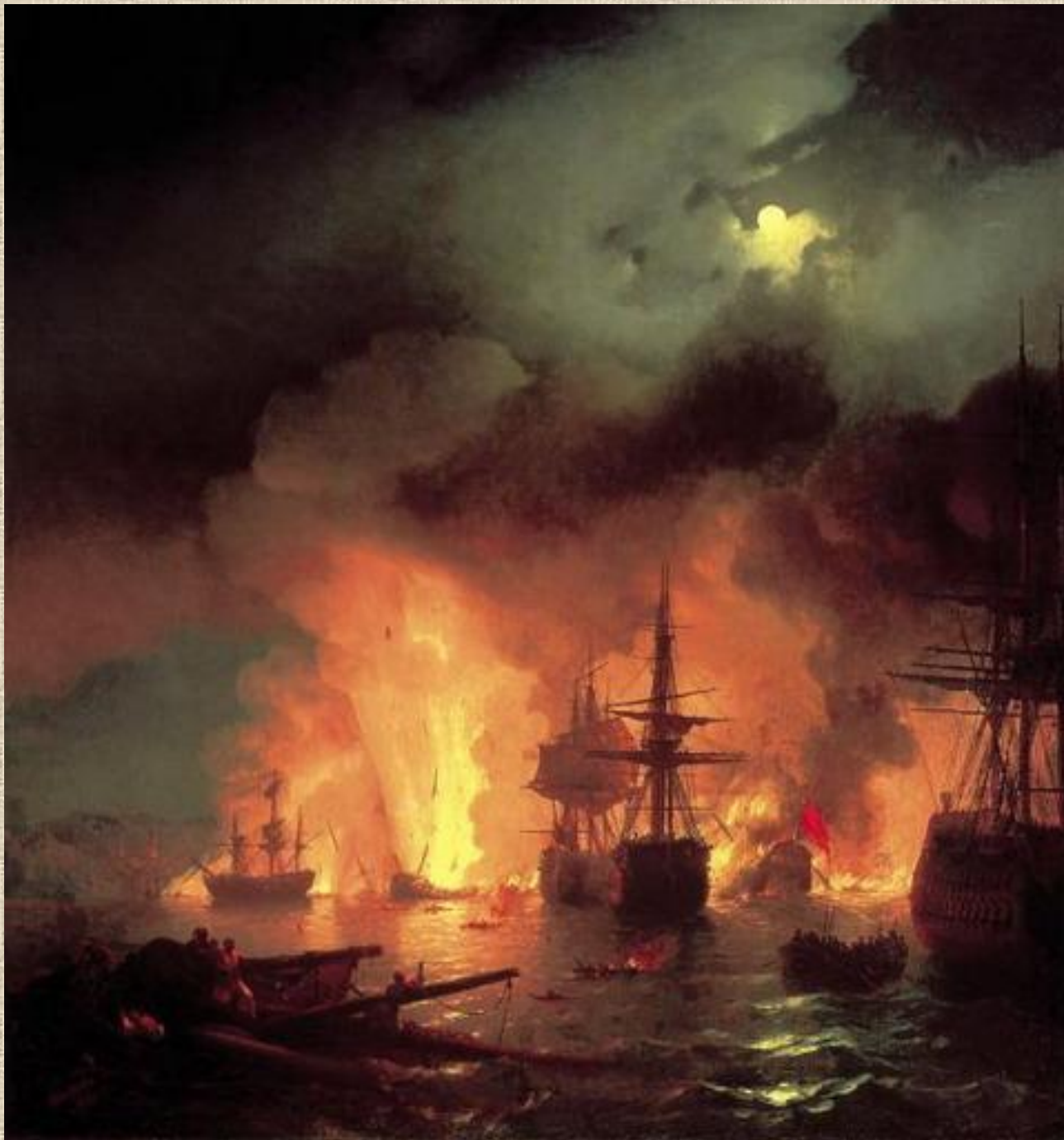
И.К. Айвазовский. Чесменский бой.