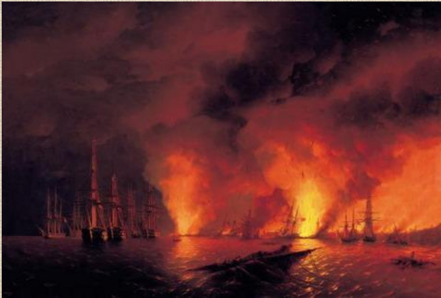
И.К. Айвазовский . Синопский бой. Ночь после боя