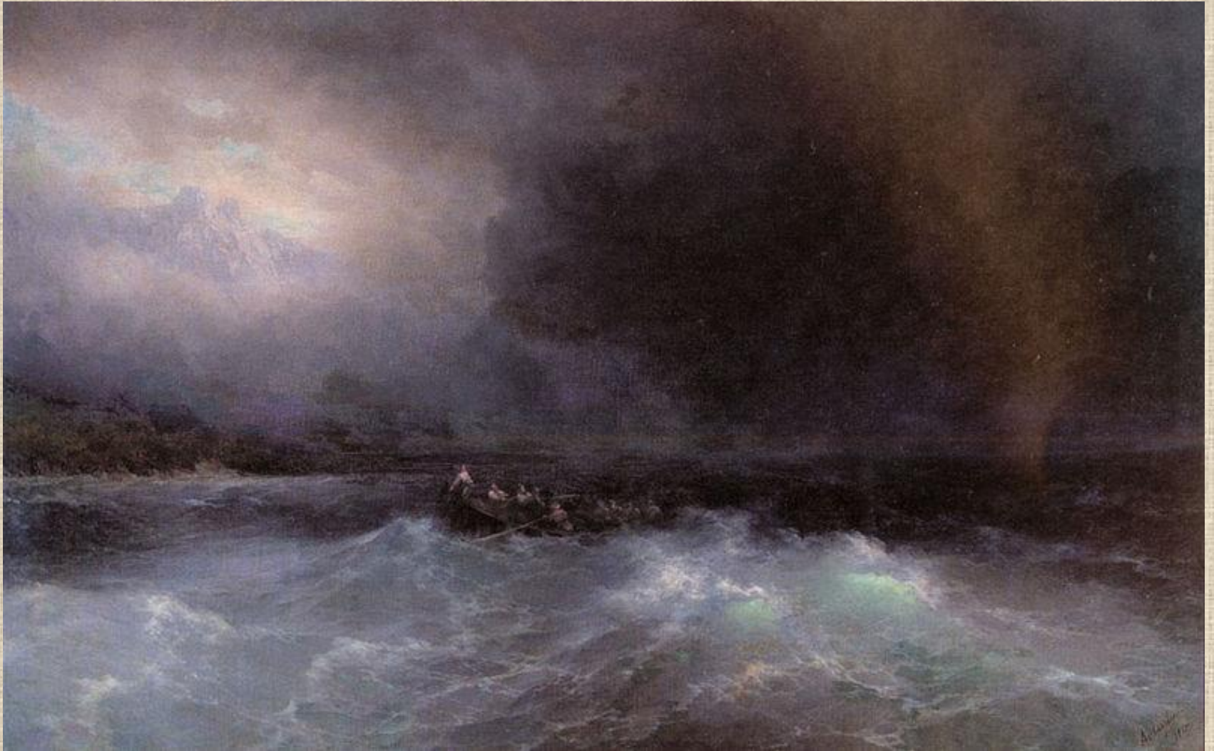
И.К. Айвазовский . Корабль в море.