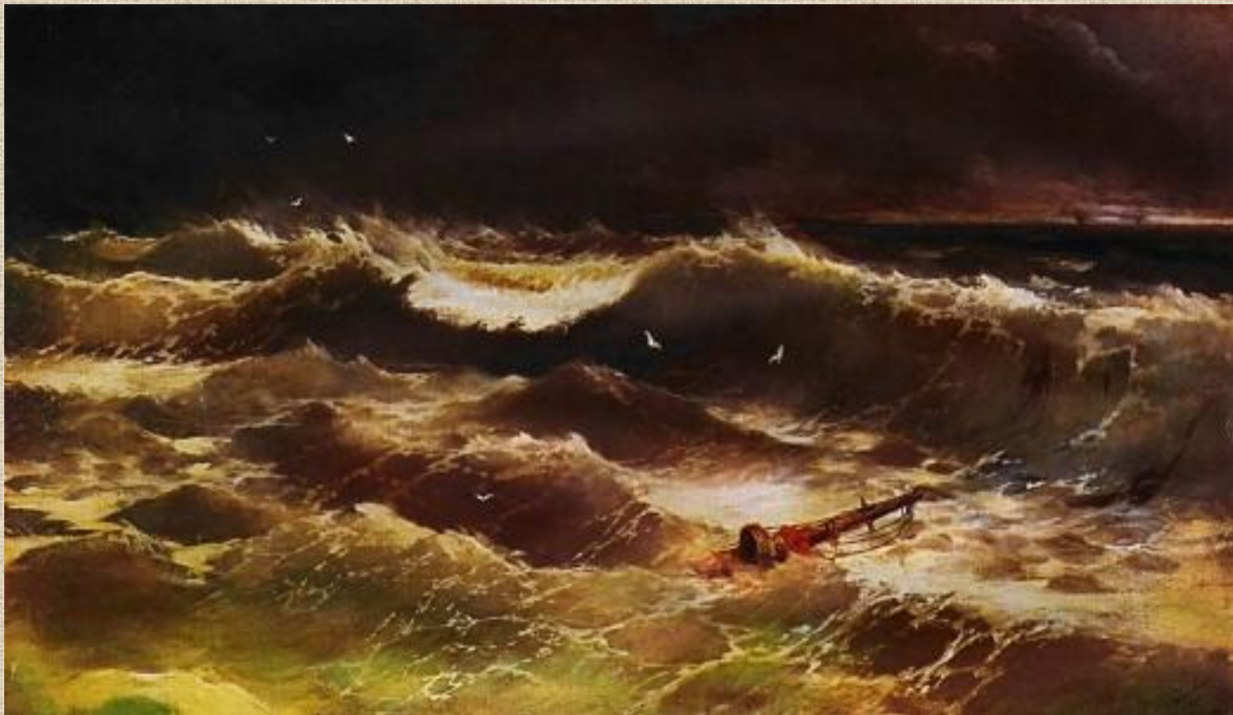
И.К. Айвазовский. Шторм.