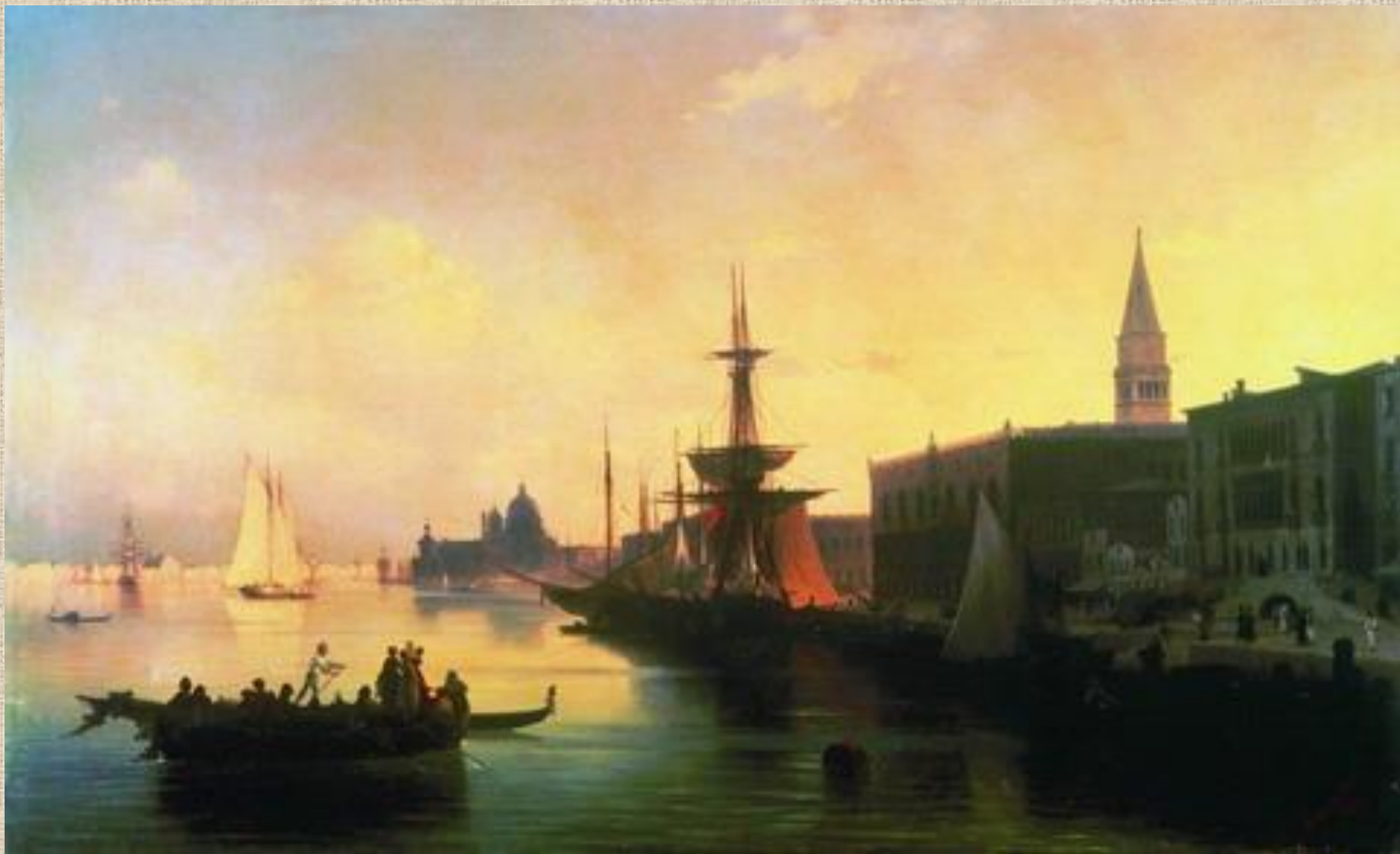
И.К. Айвазовский. Венеция.