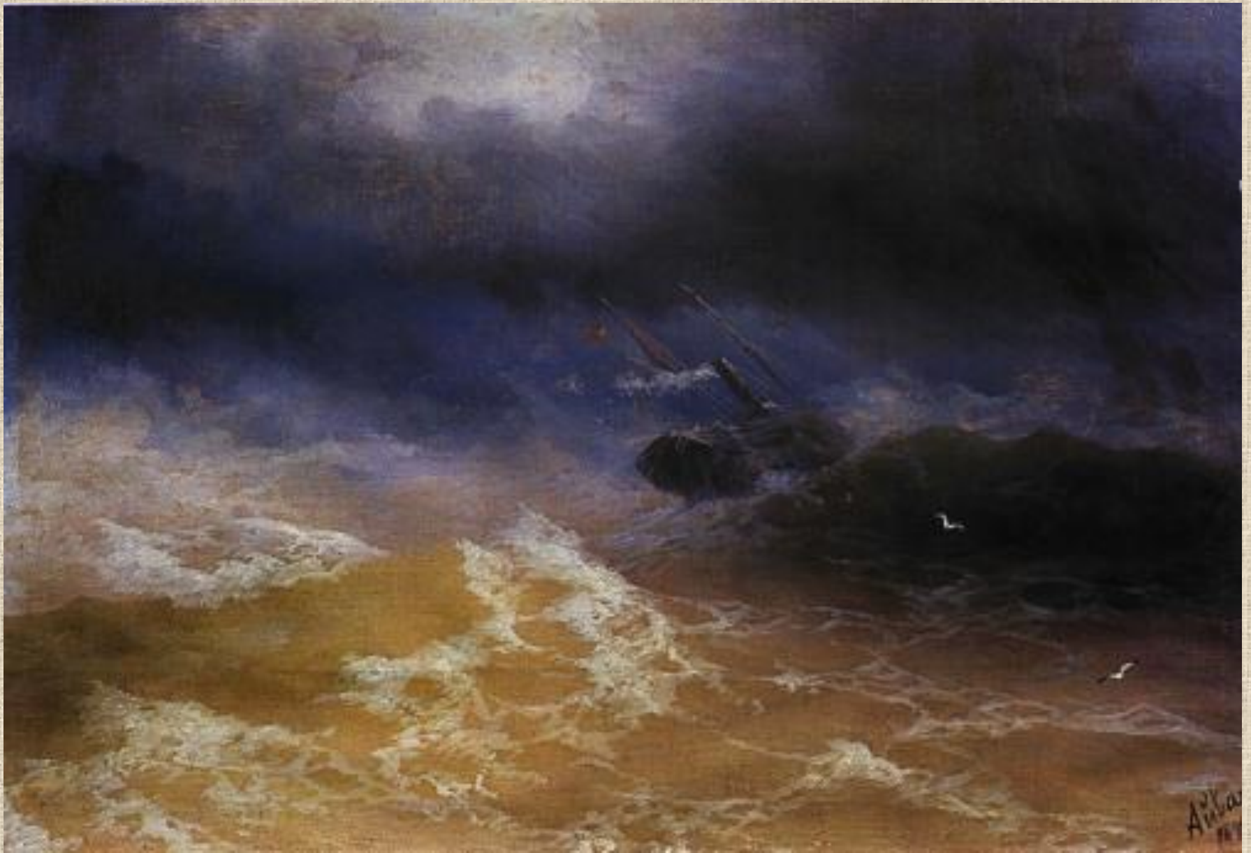
И.К. Айвазовский . Шторм на море.