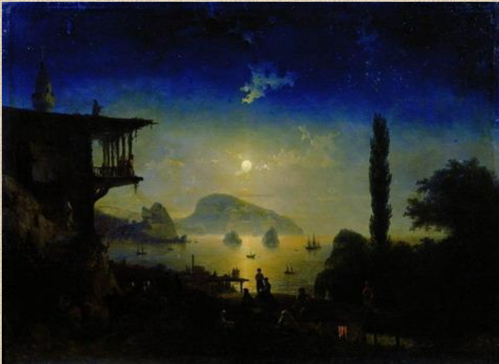
И.К. Айвазовский . Лунная ночь в