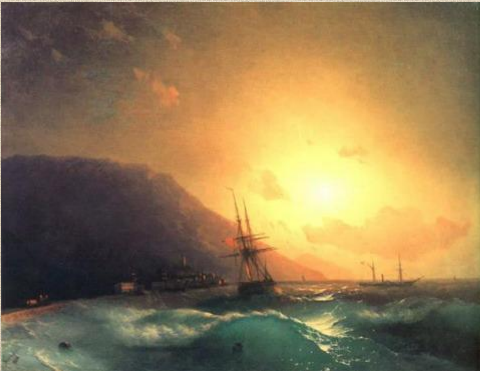
И.К. Айвазовский. У берегов Ялты.