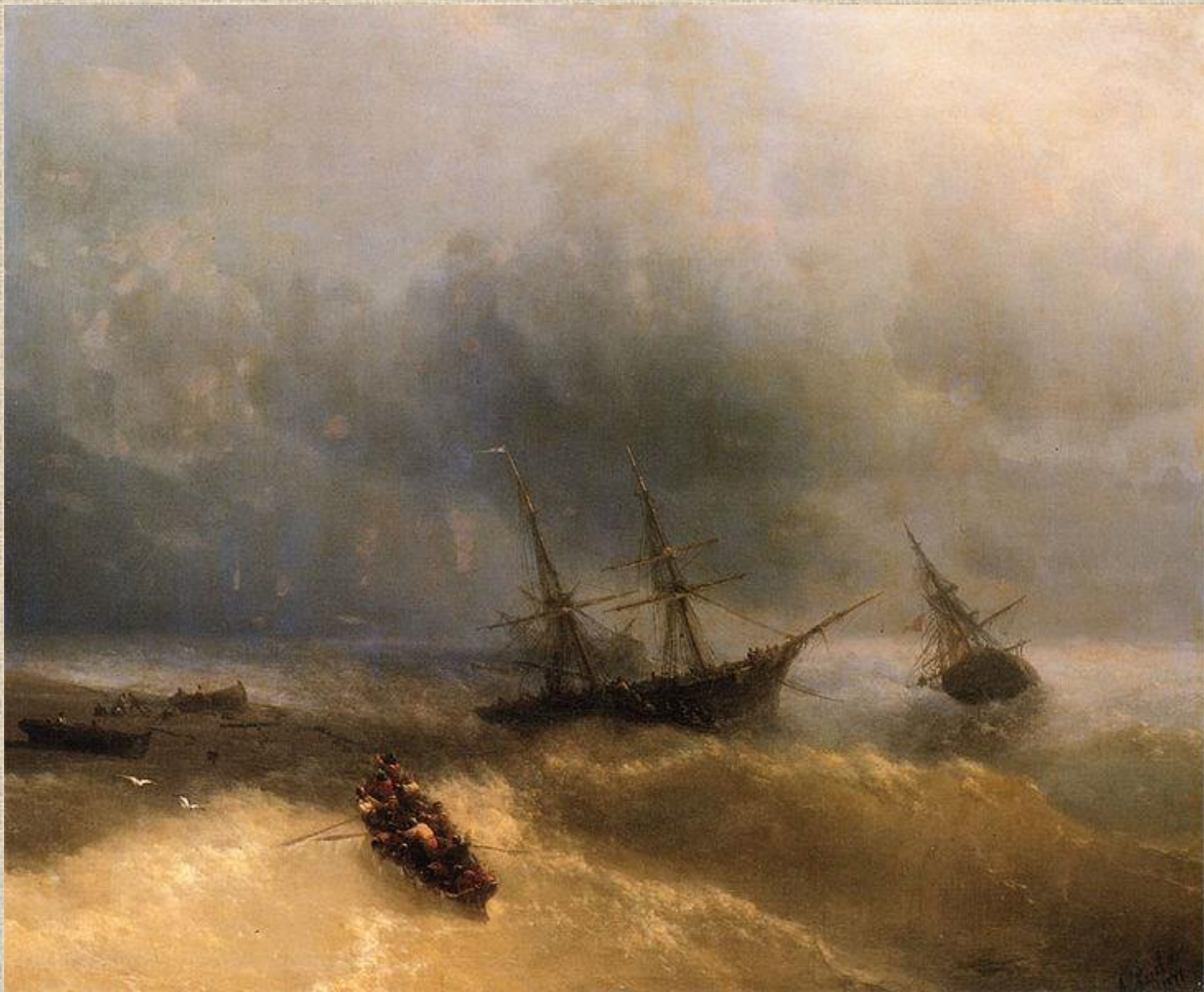
И.К. Айвазовский. Кораблекрушение.