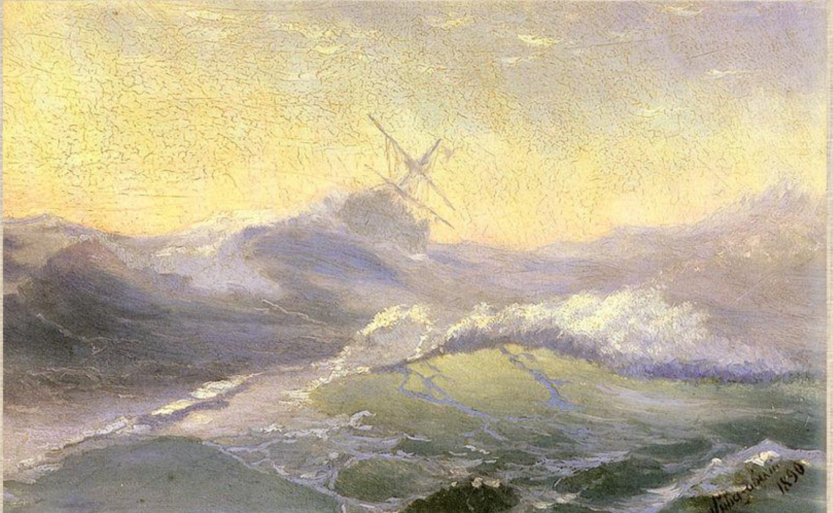
И.К. Айвазовский . Бодрящая волна.