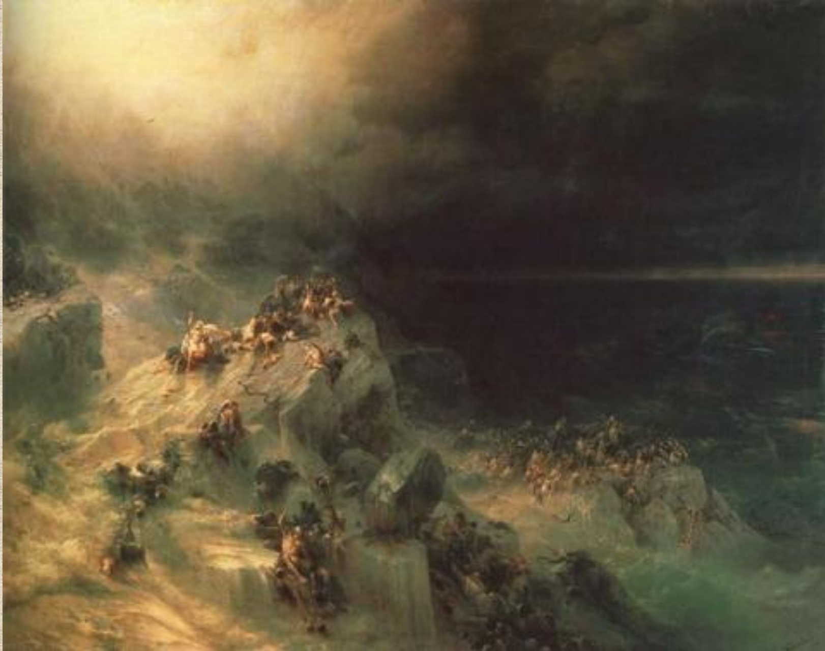
И.К. Айвазовский . Всемирный