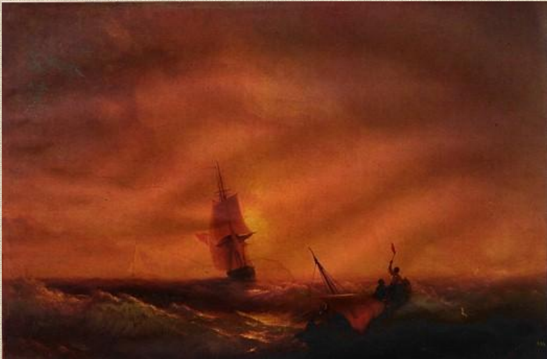
И.К. Айвазовский. Спасённые.