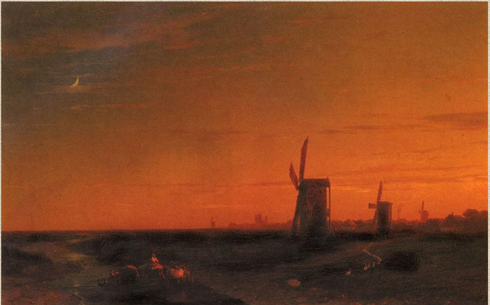
И.К. Айвазовский . Пейзаж с ветряными мельницами.