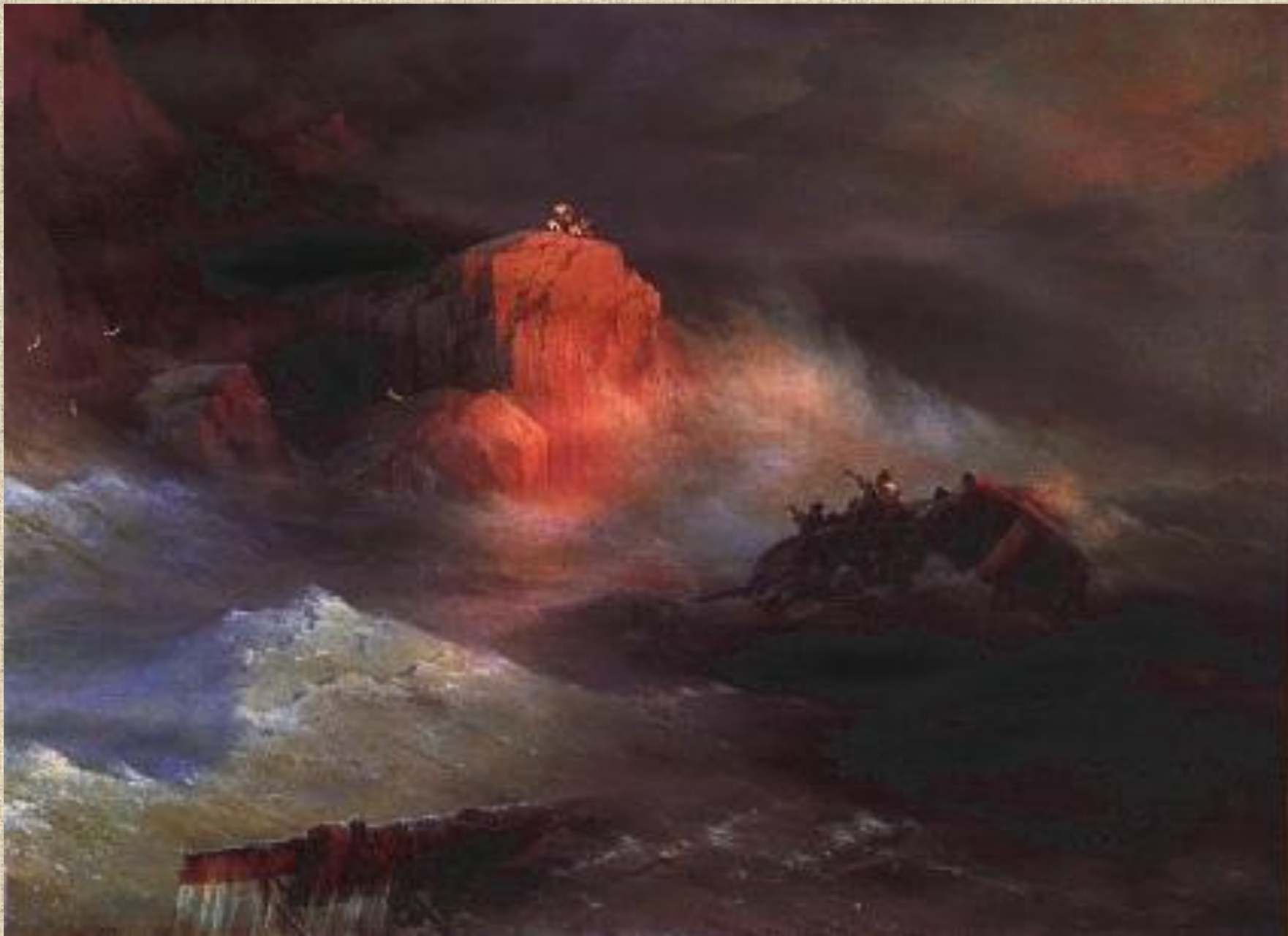
И.К. Айвазовский. Кораблекрушение.