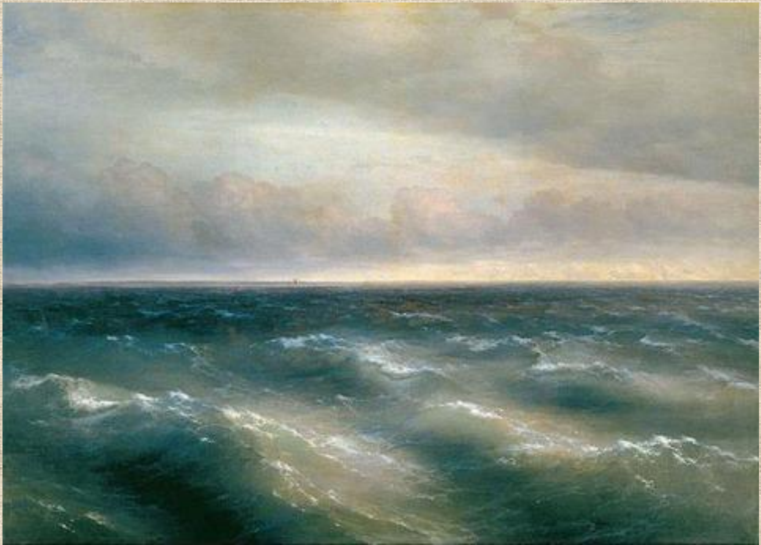
И. Айвазовский. Чёрное море. (хранится в Третьяковской галерее)

Сюжет картины прост – вода, волны и ...небо. Где-то вдали одинокий парус. Взятая художником высокая точка зрения даёт возможность создать иллюзию