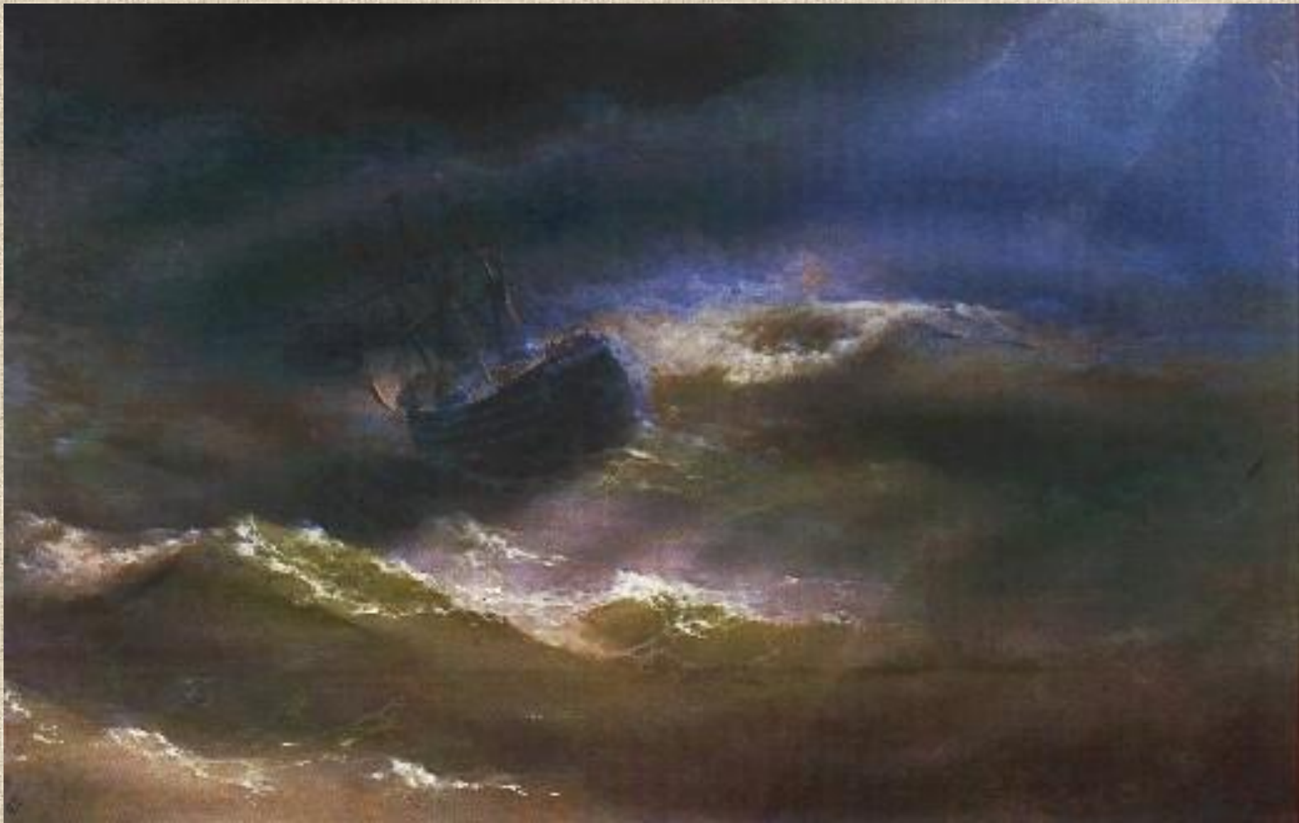
И.К. Айвазовский. «Мария» в шторм.