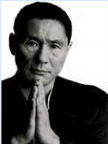
Известный японский писатель и кинорежиссер