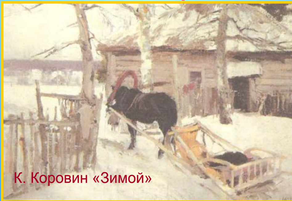
К. Коровин «Зимой»