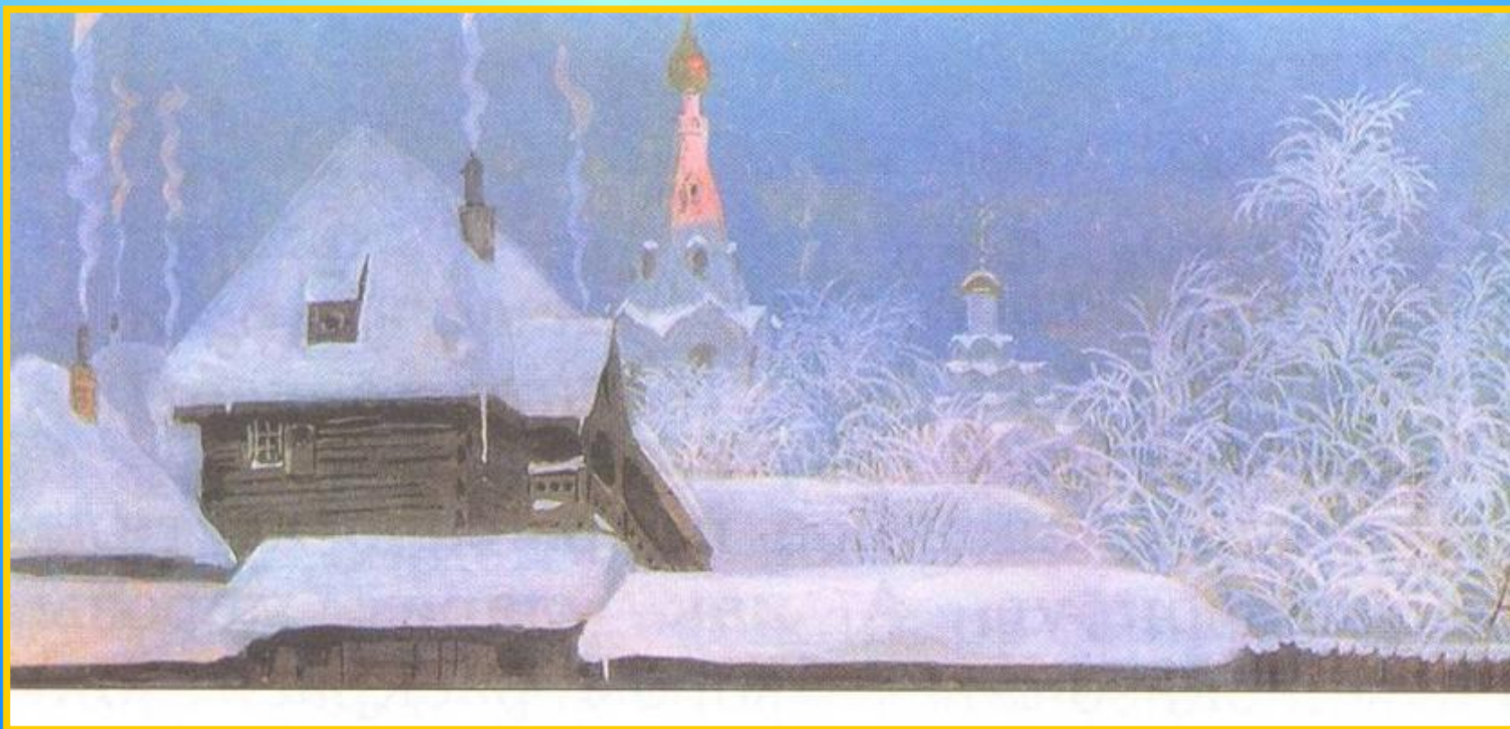
А. Рябушкин «Зимнее утро»