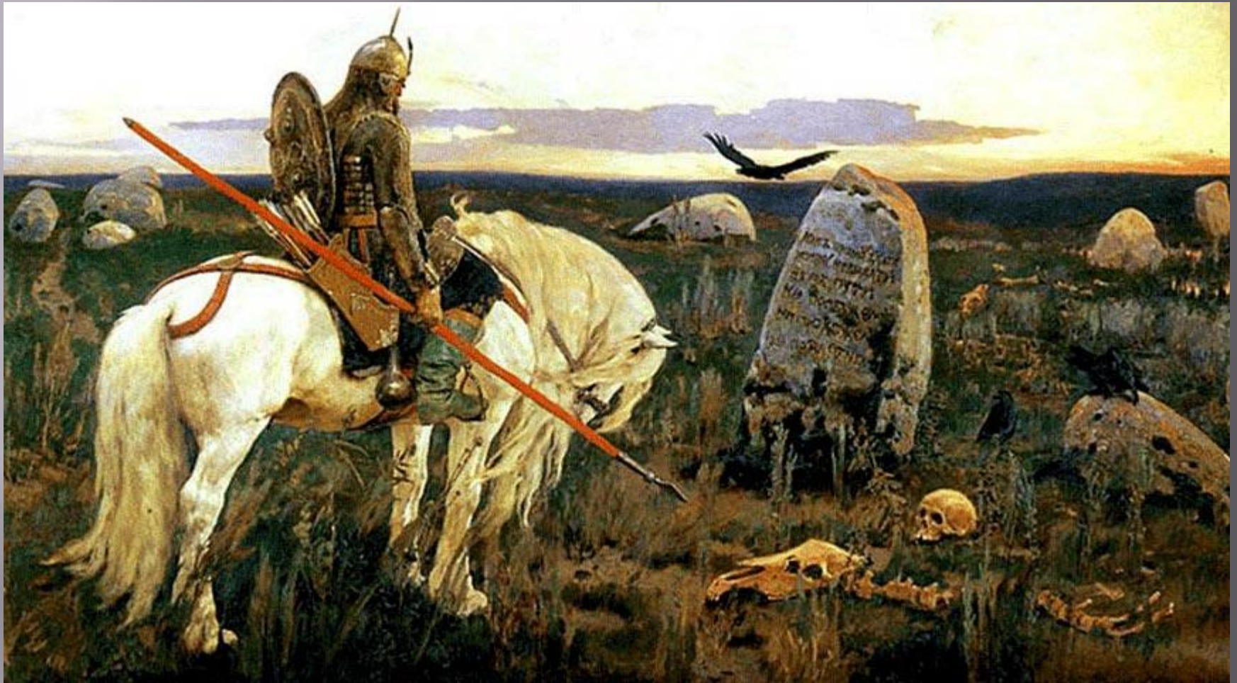
«Витязь на распутье» 1878 год