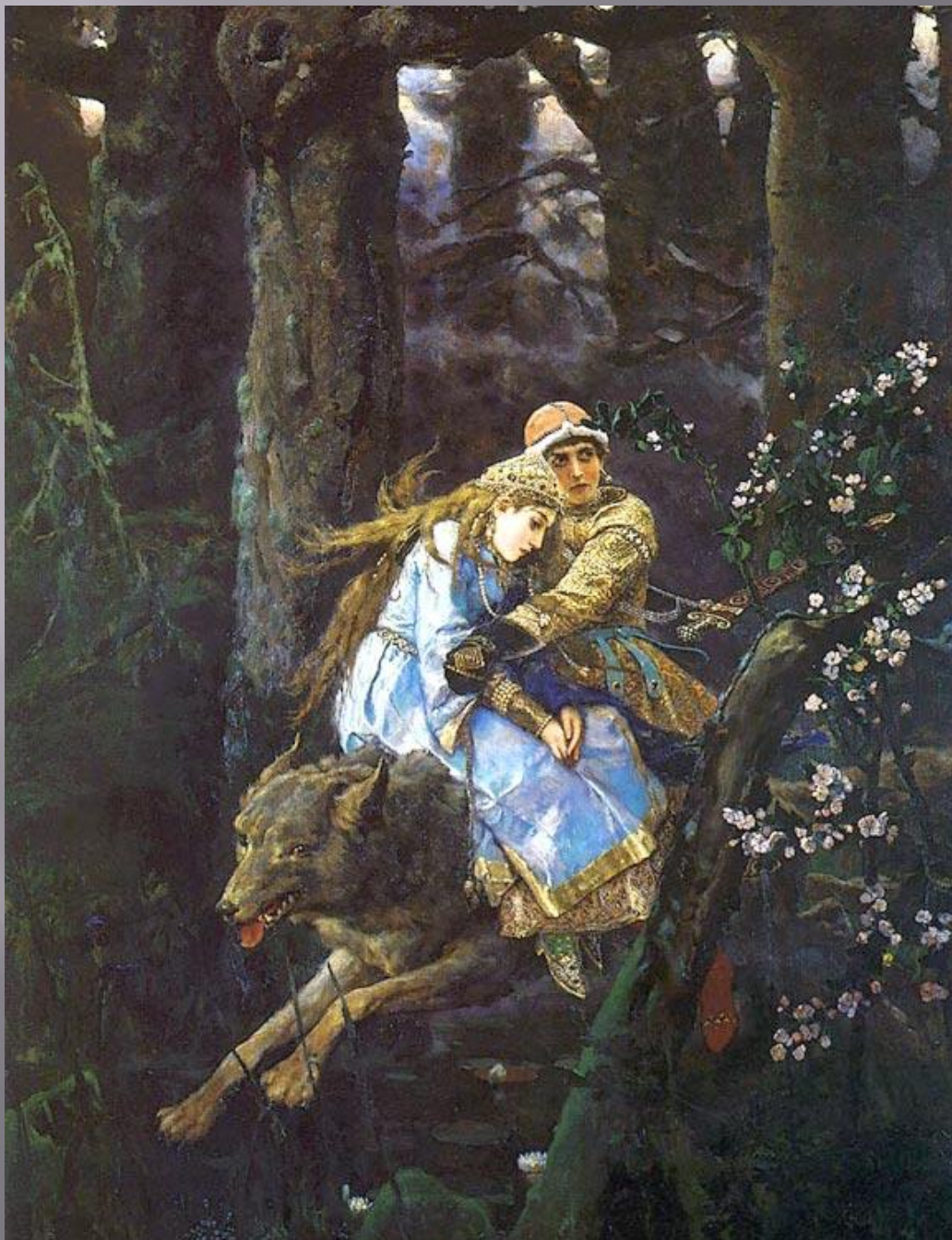
«Иван Царевич на сером волке» 1889 год