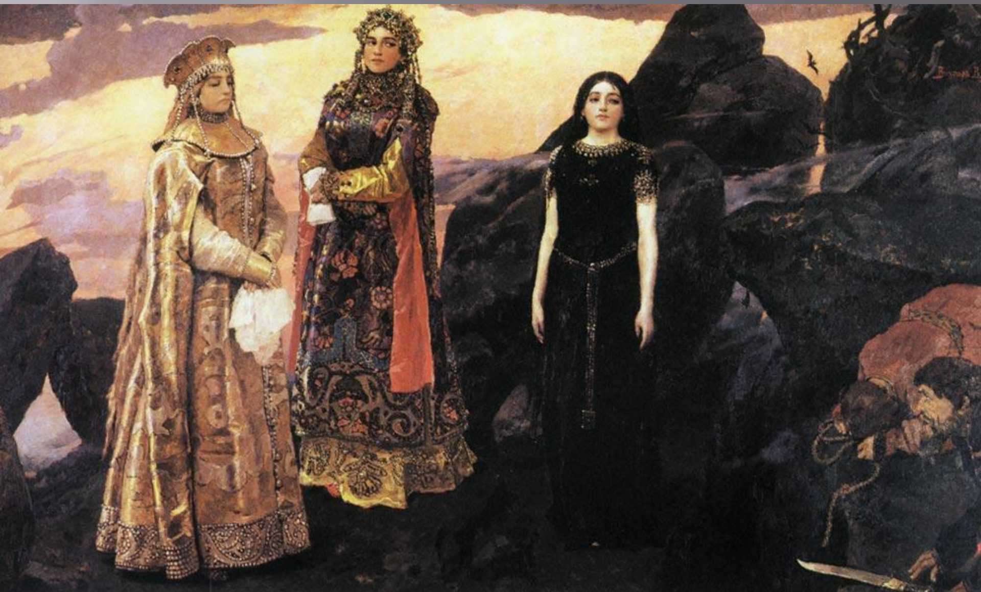
«Три царевны подземного царства» 1884 ГОД