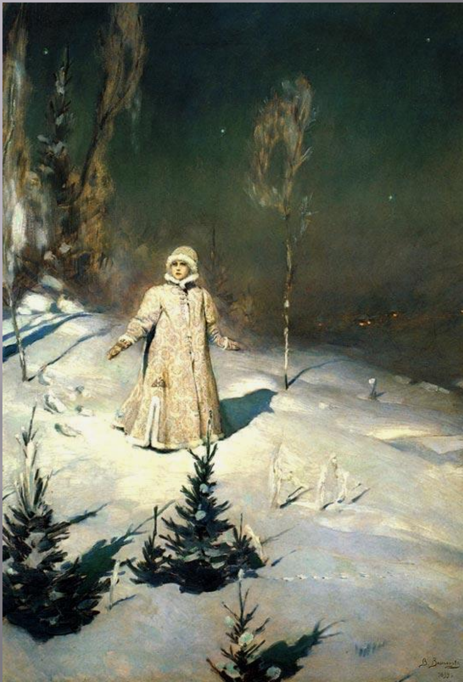
«Снегурочка» 1899 год