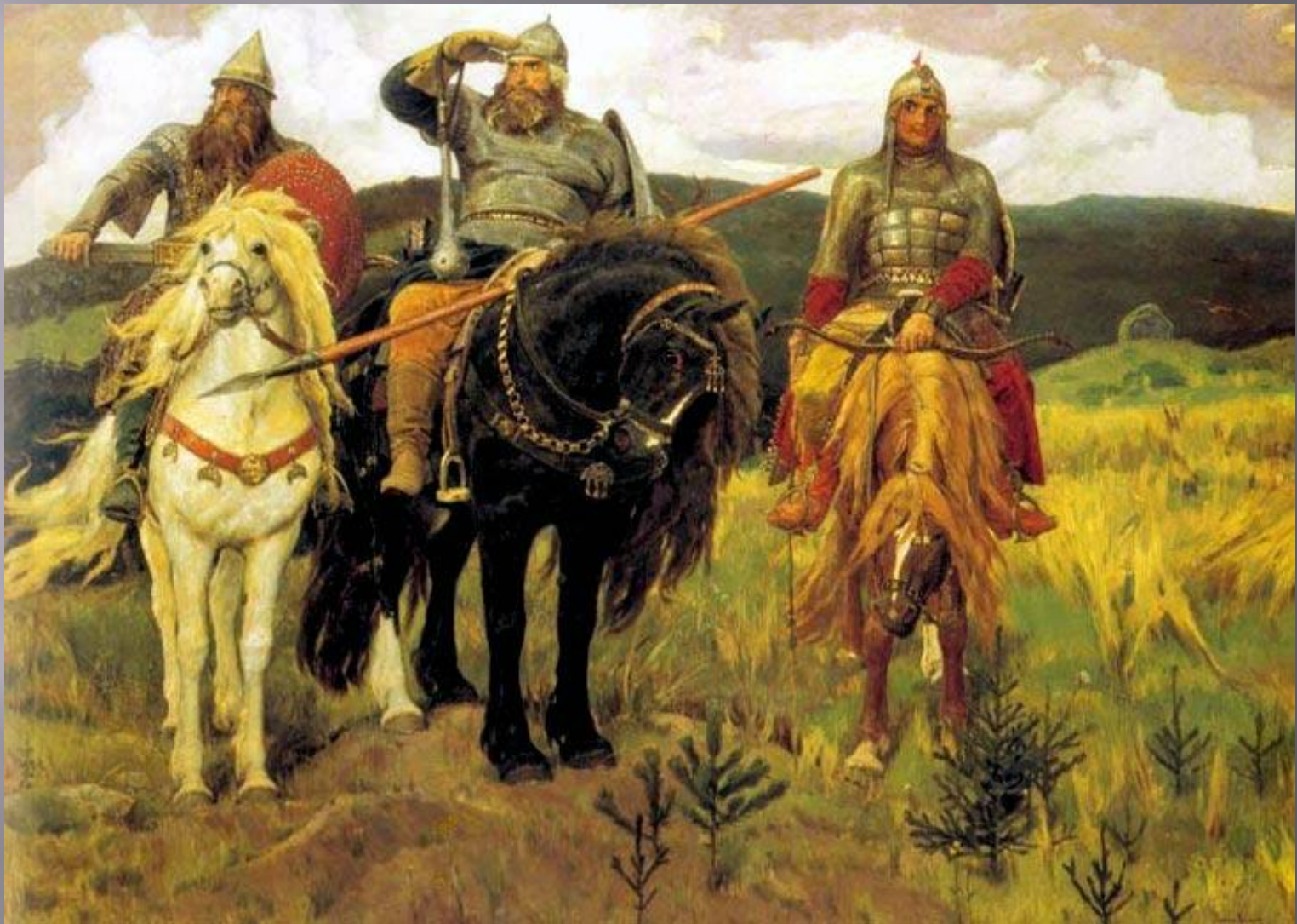
«Богатыри» 1898 год