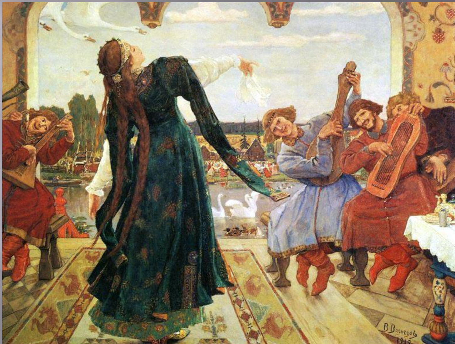
«Царевна лягушка» 1918 год