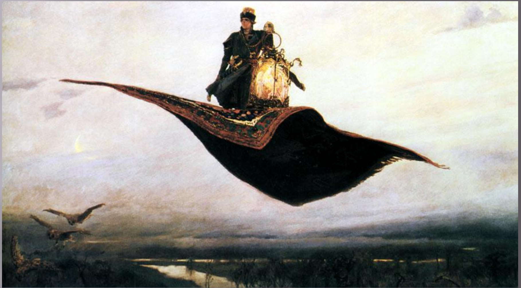
«Ковёр самолёт» 1880 год