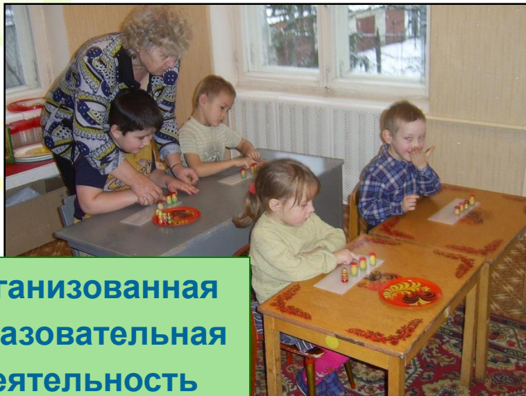
Организованная образовательная деятельность