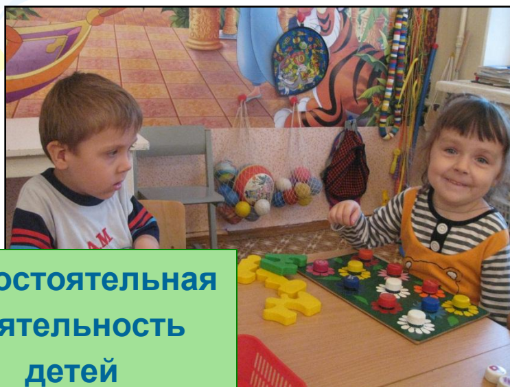
Самостоятельная деятельность детей