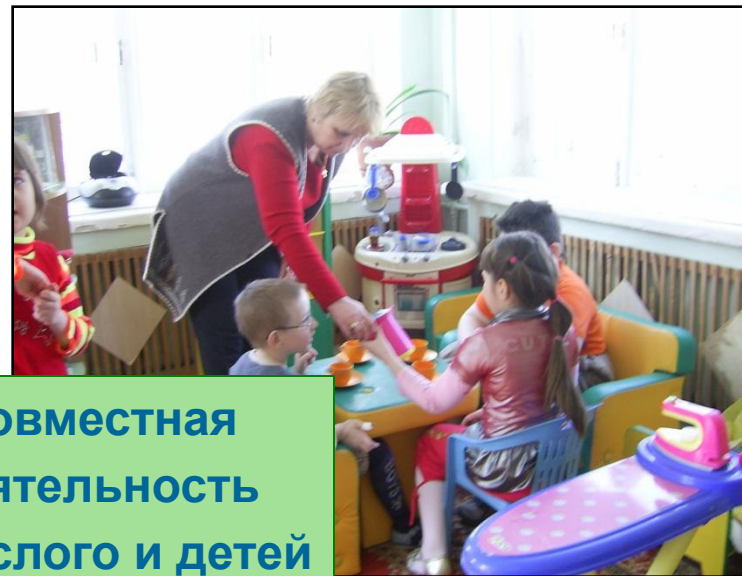
Совместная деятельность взрослого и детей