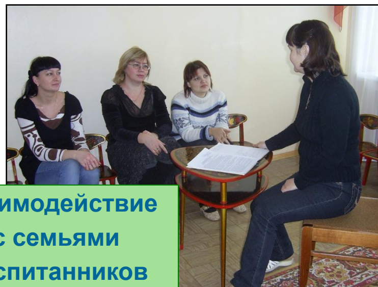
Взаимодействие с семьями воспитанников