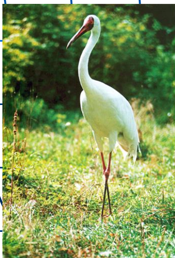
стрех, белый журавль