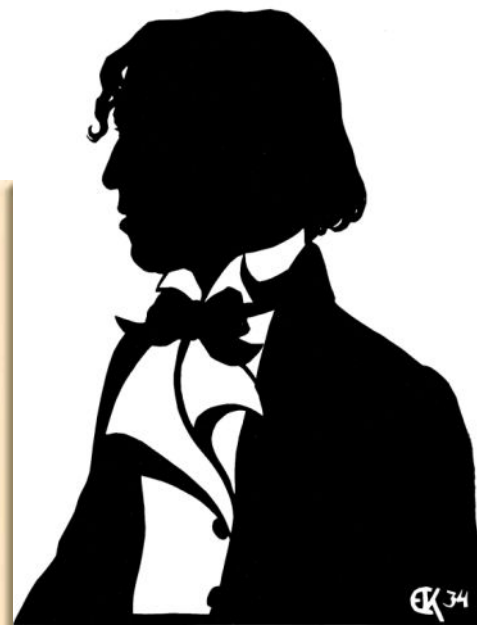
Автопортрет, Силуэт, 1934. Е.С. Кругликова