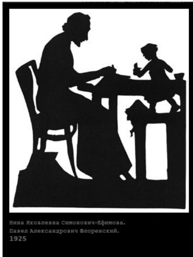
Инна Яковлевна Симонович-Ефимова. Павел Александрович Флоренский. 1925