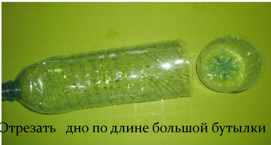
2. Отрезать дно по длине большой бутылки