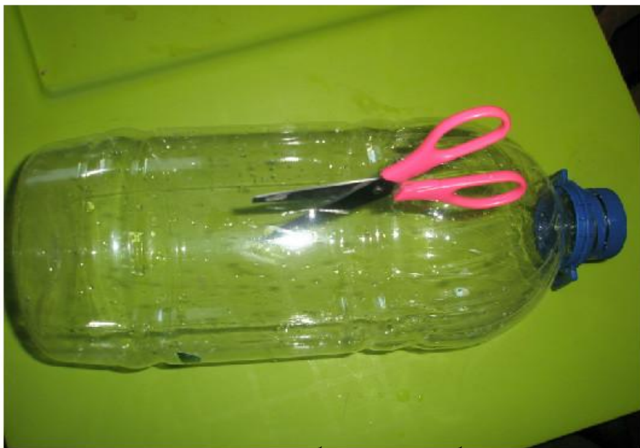
3. Вырезать окно в большой бутылке