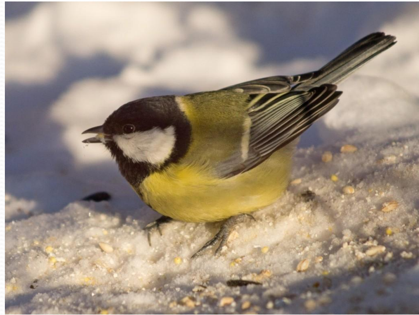
С И Н И Ц А