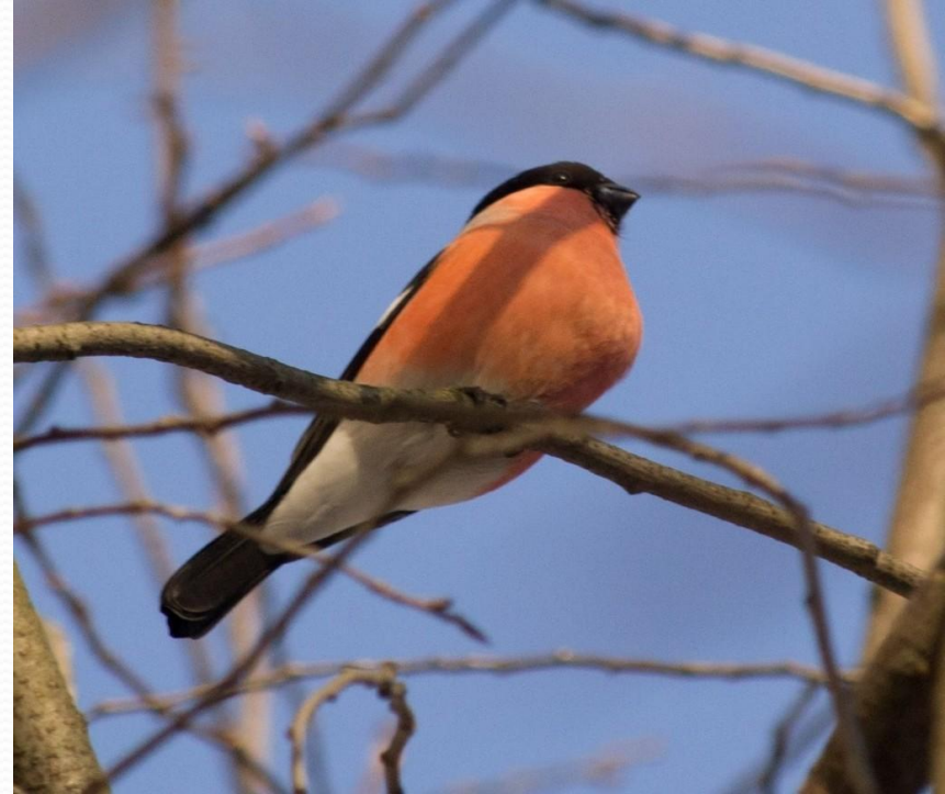
С Н Е Г И Р Ь

Пусть я птичка-невеличка, У меня, друзья, привычка - Как начнутся холода, Прямо с севера сюда.