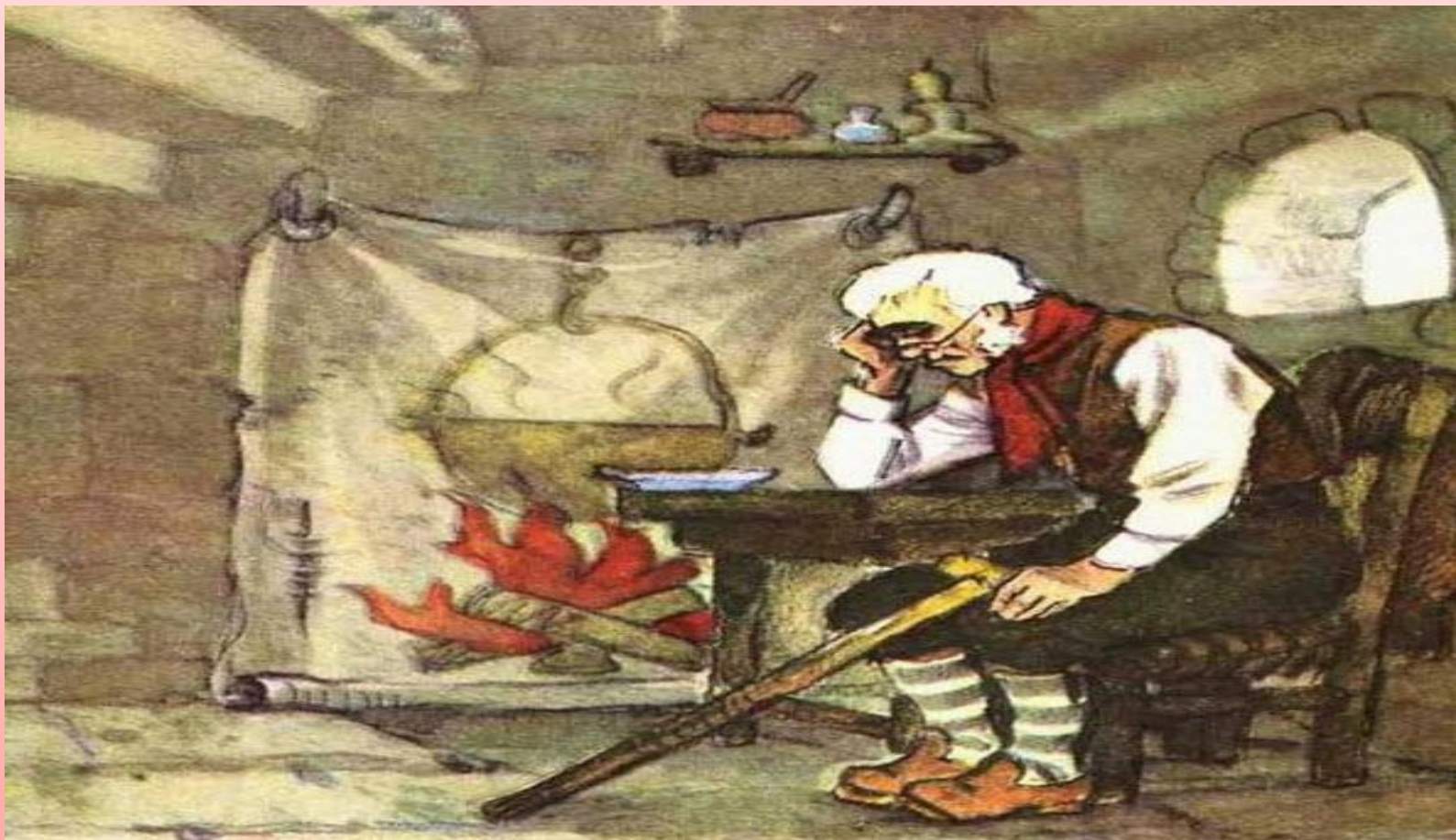
А.Н. Толстой «Золотой ключик», жилище шарманщика Карло