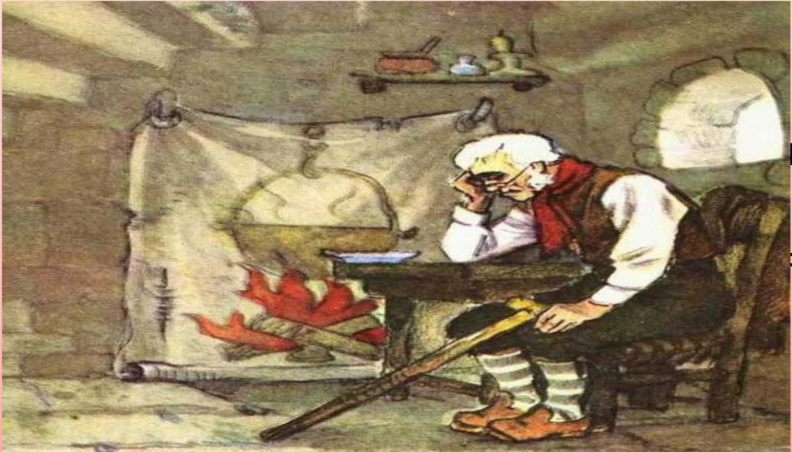
А.Н. Толстой «Золотой ключик», жилище шарманщика Карло