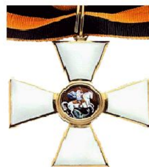
Орден Святого Георгия