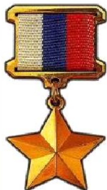
Звезда Героя Российской Федерации