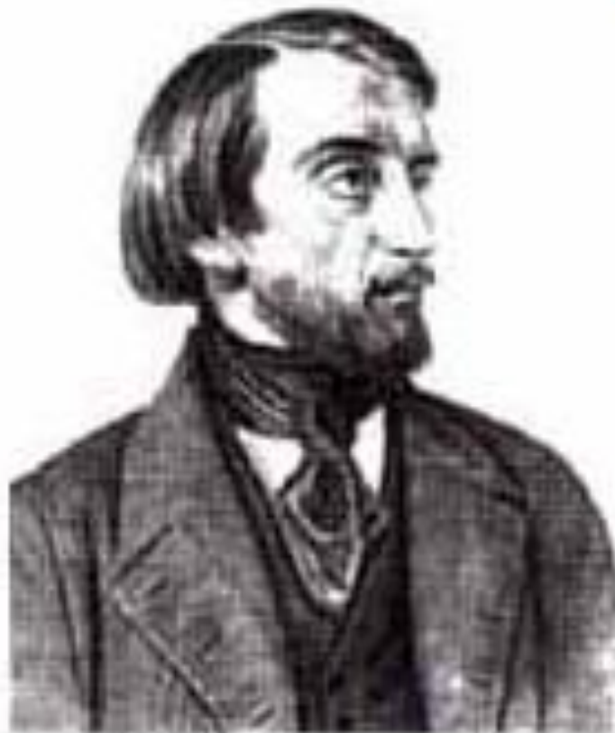
В. Г. Белинский