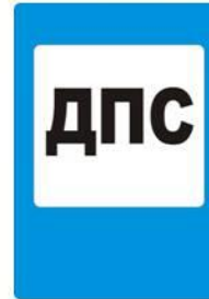
Пост дорожно – патрульной службы