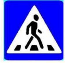
Пешеходный переход (место перехода через дорогу)