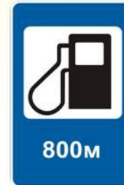
Авто – заправочная станция