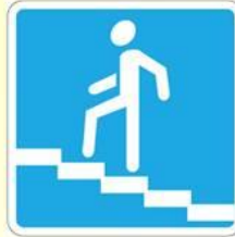
Подземный пешеходный переход (место перехода через дорогу)

- Информировуют о расположении населенных пунктов и других объектов