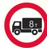
Движение грузовых автомобилей запрещено