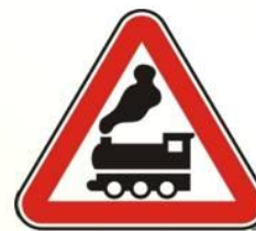
Железнодорожный переезд без шлагбаума