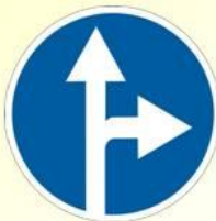
Движение прямо и направо