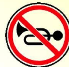
Подача звукового сигнала запрещена