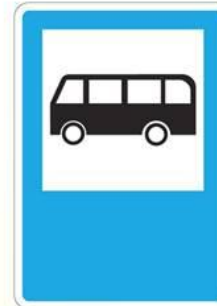
Место остановки автобусов