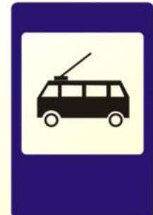
Место остановки троллейбусов