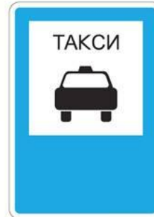
Место остановки такси