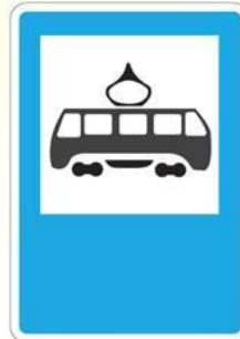
Место остановки трамвая