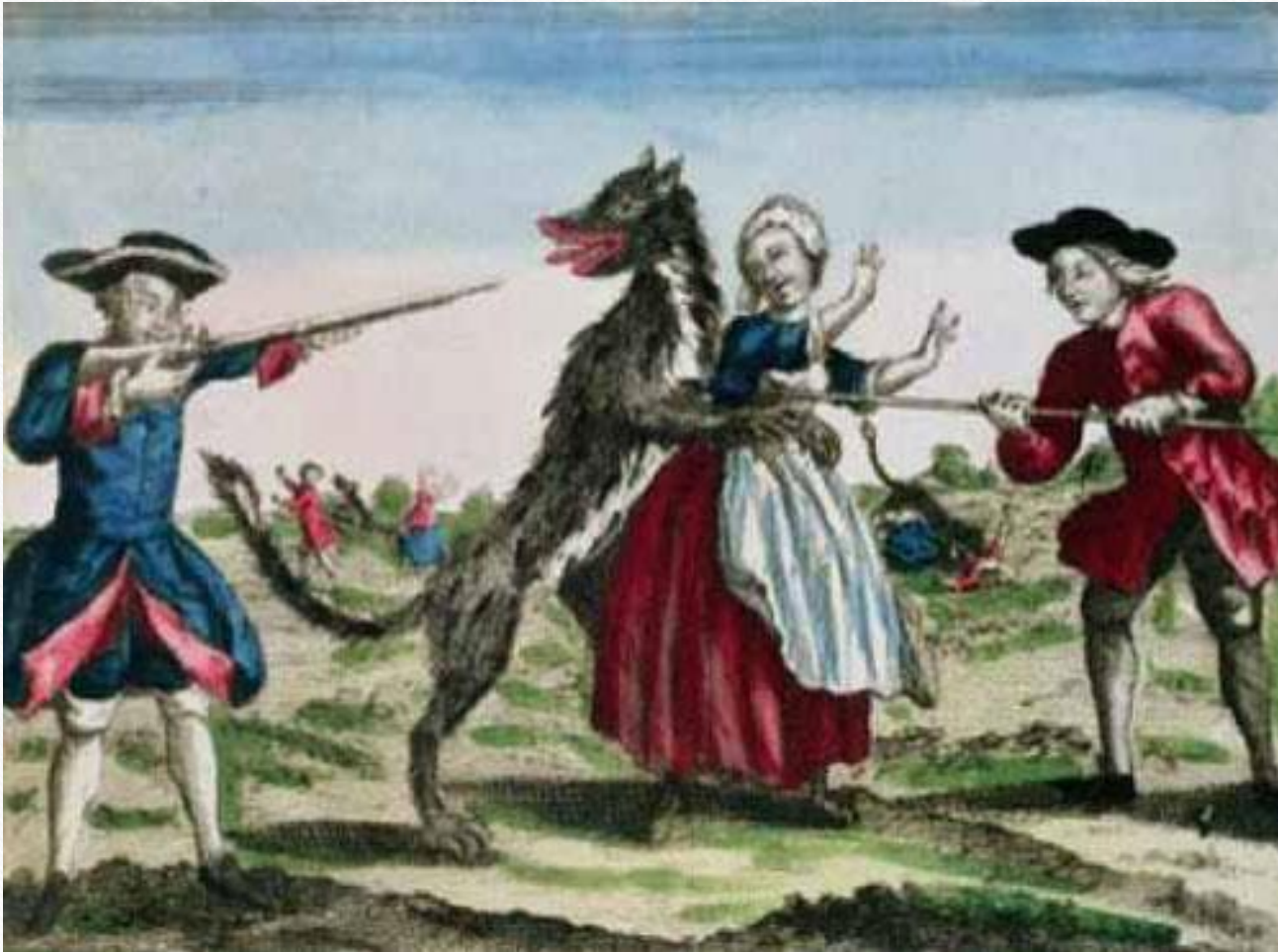
Люди задержали оборотня на месте преступления

Имена же некоторых оборотней известны истории. Первое место здесь пожалуй занимает француз Жиль Гарнье. Вёл он жизнь отшельника, а обитал и творил зло на севере Франции во второй половине XVI века. Он остался в памяти людей в виде страшного и ужасного нелюдя, убивающего и взрослых, и детей. Это существо не жалело даже беременных женщин и младенцев. Убитых Жиль Гарнье поедал, уничтожая следы своих преступлений.