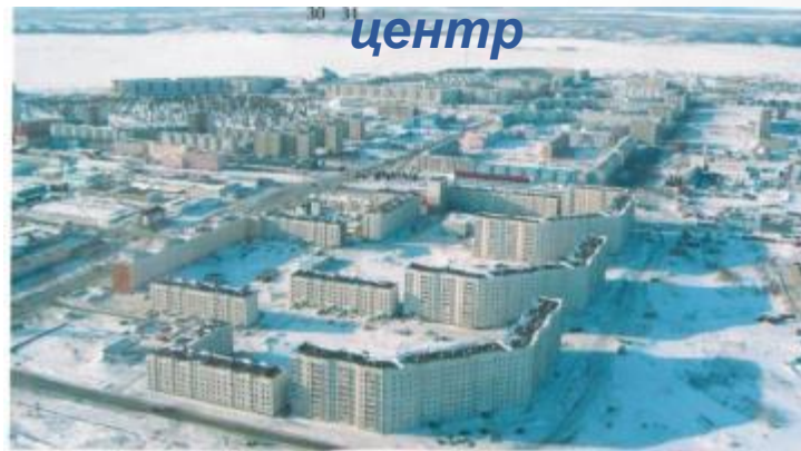
Надым - административный центр

В состав Надымского района входят три городских поселения - город Надым, поселки Пангоды и Заполярный и семь сельских поселений (в трех из которых проживают ненцы, коми-зыряне, селькупы, ханты – коренные народы Севера). Численность населения Надымского района составляет 67,8 тыс. жителей, 86% которых проживают в городских условиях