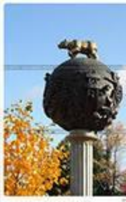
ПАМЯТНИК БЕЛЫЙ МЕДВЕДЬ НА ЗЕМНОМ ШАРЕ