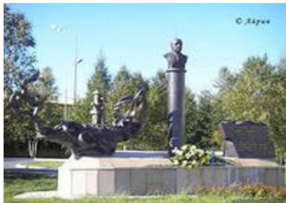
ПАМЯТНИК С.А. ОРУДЖЕВУ