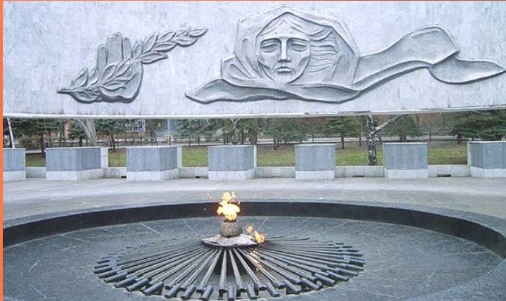
Вечный огонь и Пост №1 в г. Ростов-на-Дону (являются частью мемориального комплекса «Павшим воинам»)

Интересно, что Пост №1 в городе Ростов-на-Дону является одним из немногих, а может и единственным местом в России, где почетный караул несут старшеклассники. Смена караулов проходит каждые 15-20 минут. Караульные одеты в парадную форму и вооружены автоматами. Школьники изучают устав, занимаются маршировкой, строевыми учениями и принимают торжественную клятву. Пост действует с 1975 года.