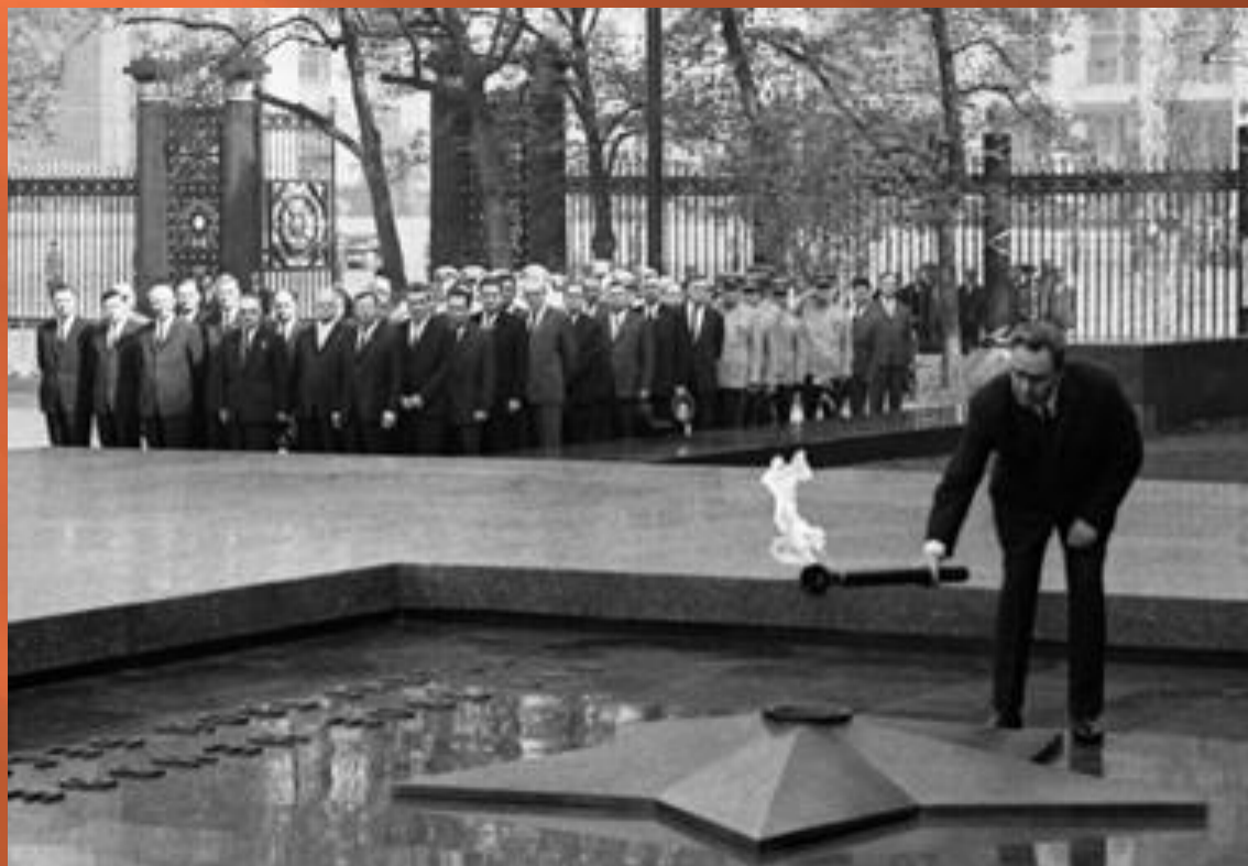
Л.И. Брежнев зажигает Вечный огонь на могиле Неизвестного солдата (1967 г.)

Мемориальный архитектурный ансамбль «Могила Неизвестного Солдата» был открыт 8 мая 1967 года.