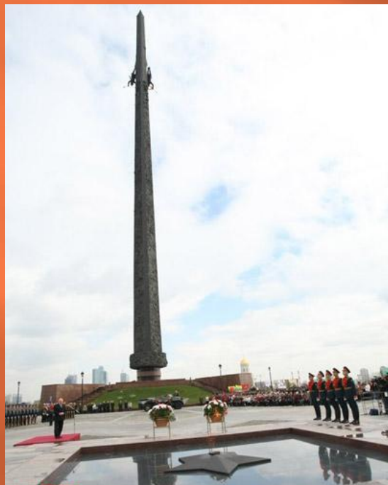
Вечный огонь (Огонь Памяти и Славы) на Поклонной горе

Два других Вечных огня в Москве установлено на Поклонной горе и Преображенском кладбище.