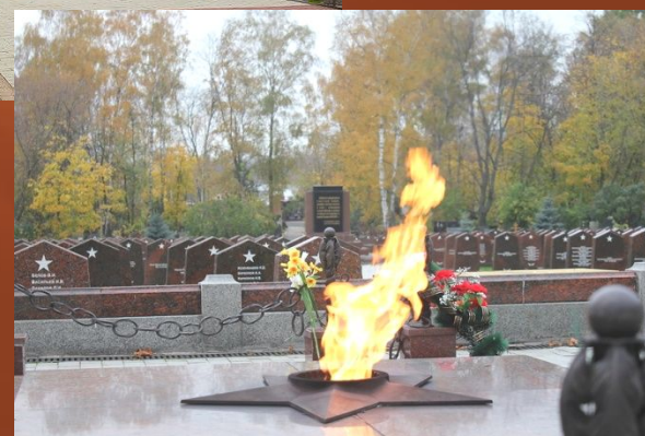
Вечный огонь на Преображенском кладбище