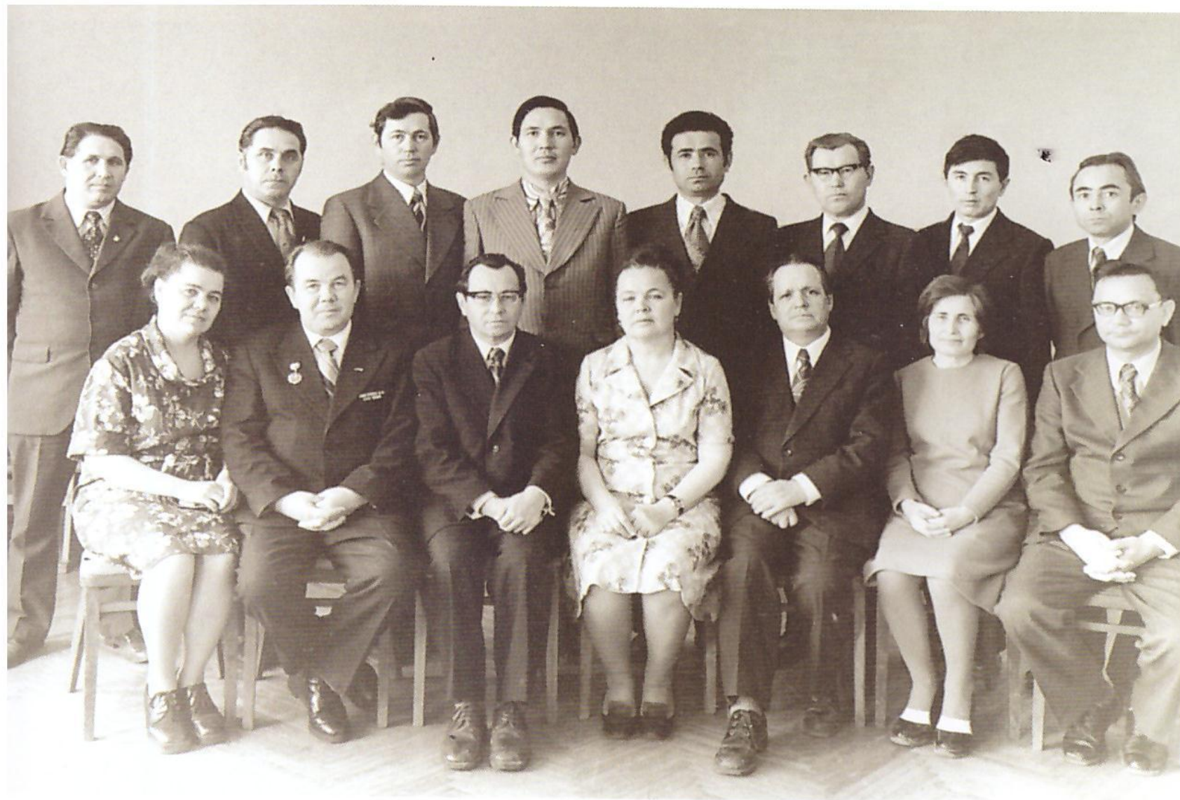
Тарих, тел һәм әзәбиәт институтының әзәбиәт секторы хезмәткәрзәре. 1978