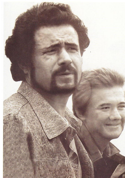
Улым Айзар менән. 1978