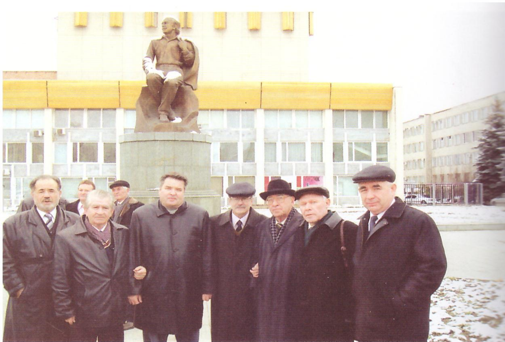
Кайсын Кулиевтың 90 йыллығында. Нальчик, 2007