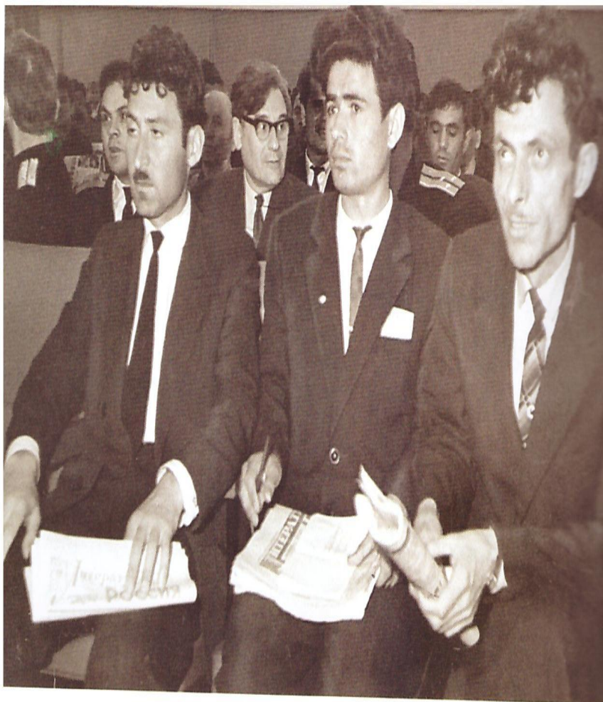
Йәш языусыларзың Бөтә союз конференцияһында. Мәскәү, 1963