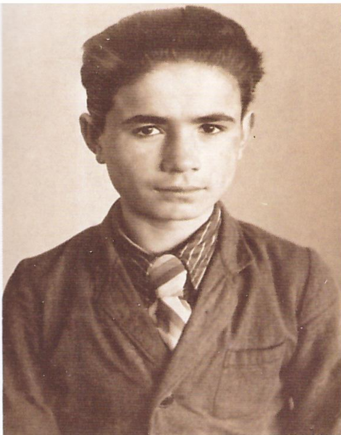
Акбулак педагогика училищени студенти. 1954