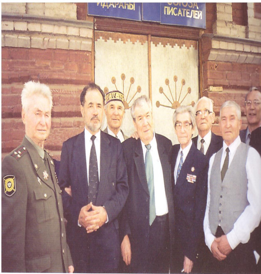
Языусылар союзында яугир языусылар менэн. 2003