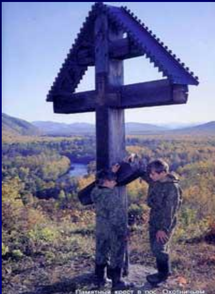
Памятный крест в пос. Охотничьем