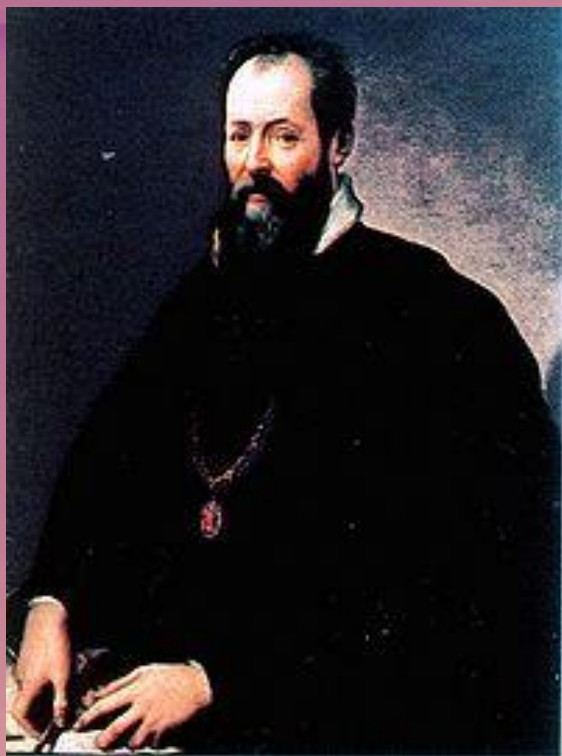
Джорджо Вазари (1511-1574)

Итальянский живописец, архитектор и писатель. Известен также как автор биографий итальянских художников. Именно Джорджо Вазари первым ввел термин «Возрождение».