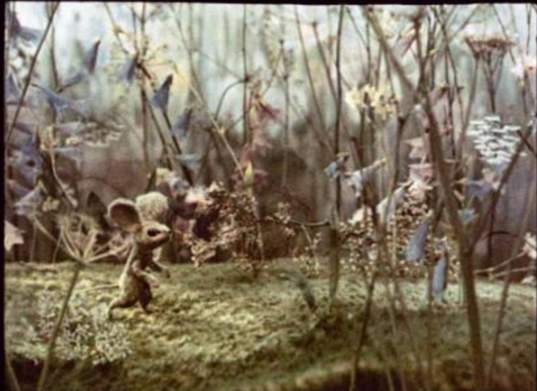
Бежит мимо мышка-норушка