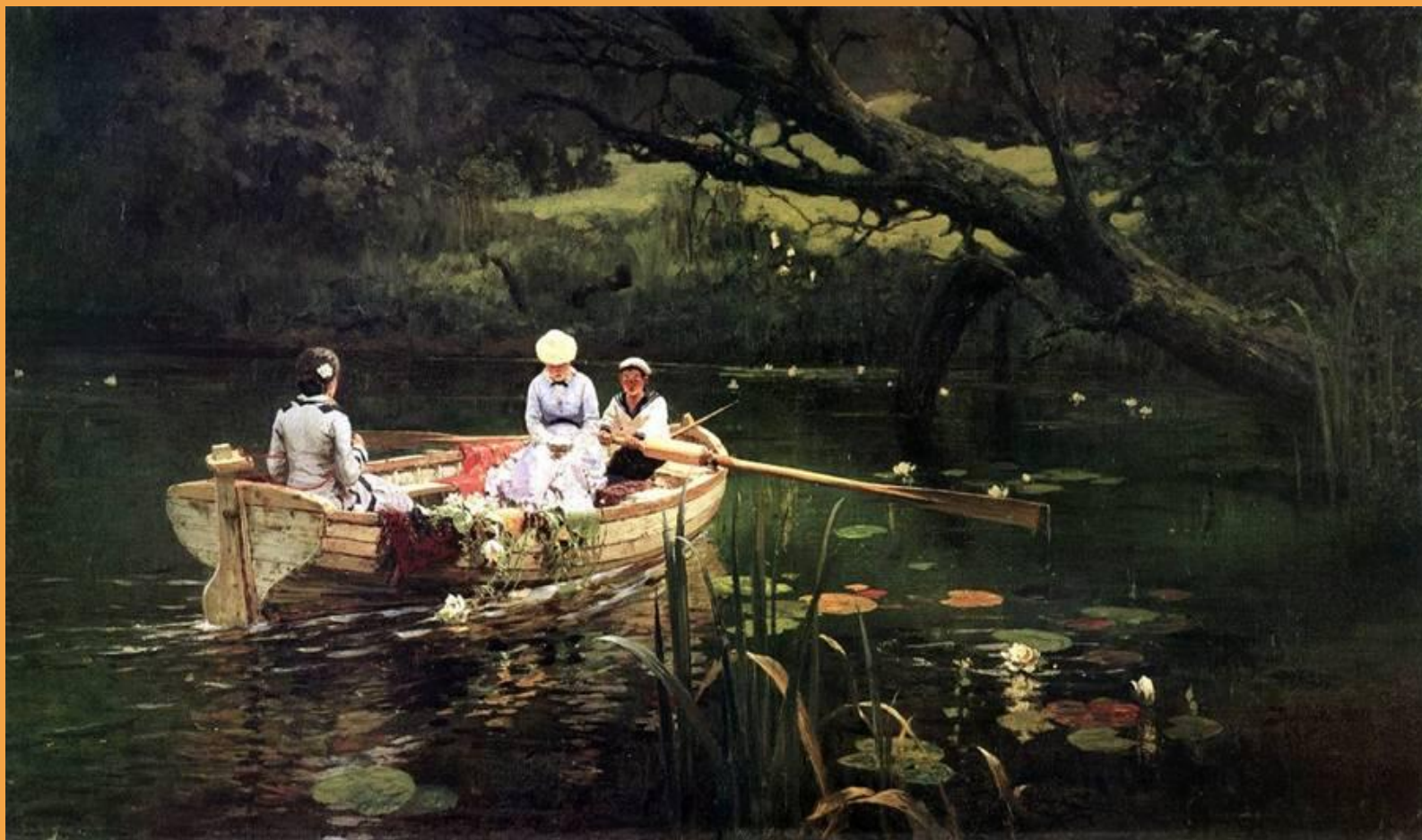
В Поленов. На лодке.