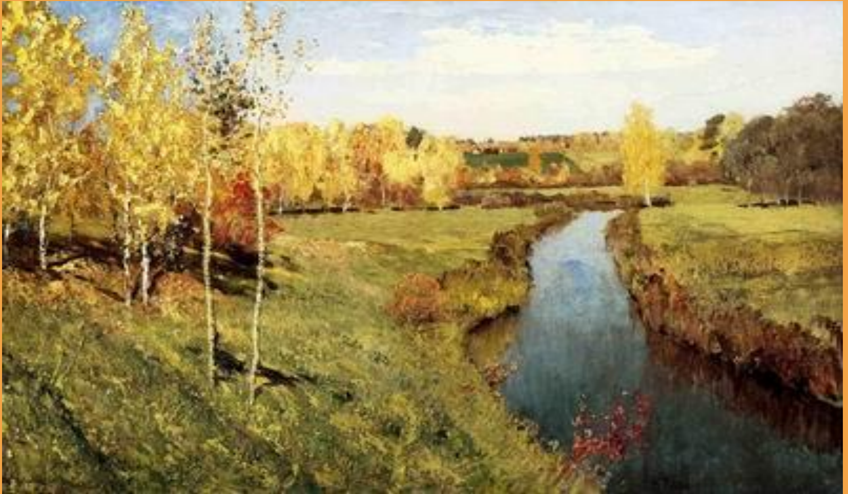
И. Левитан. Золотая осень