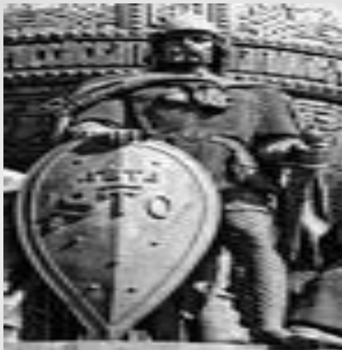
Князь Рюрик на памятнике Тысячелетия России г. Великий Новгород, 2004