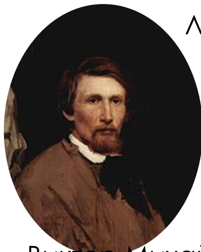
Виктор Михайлович Васнецов