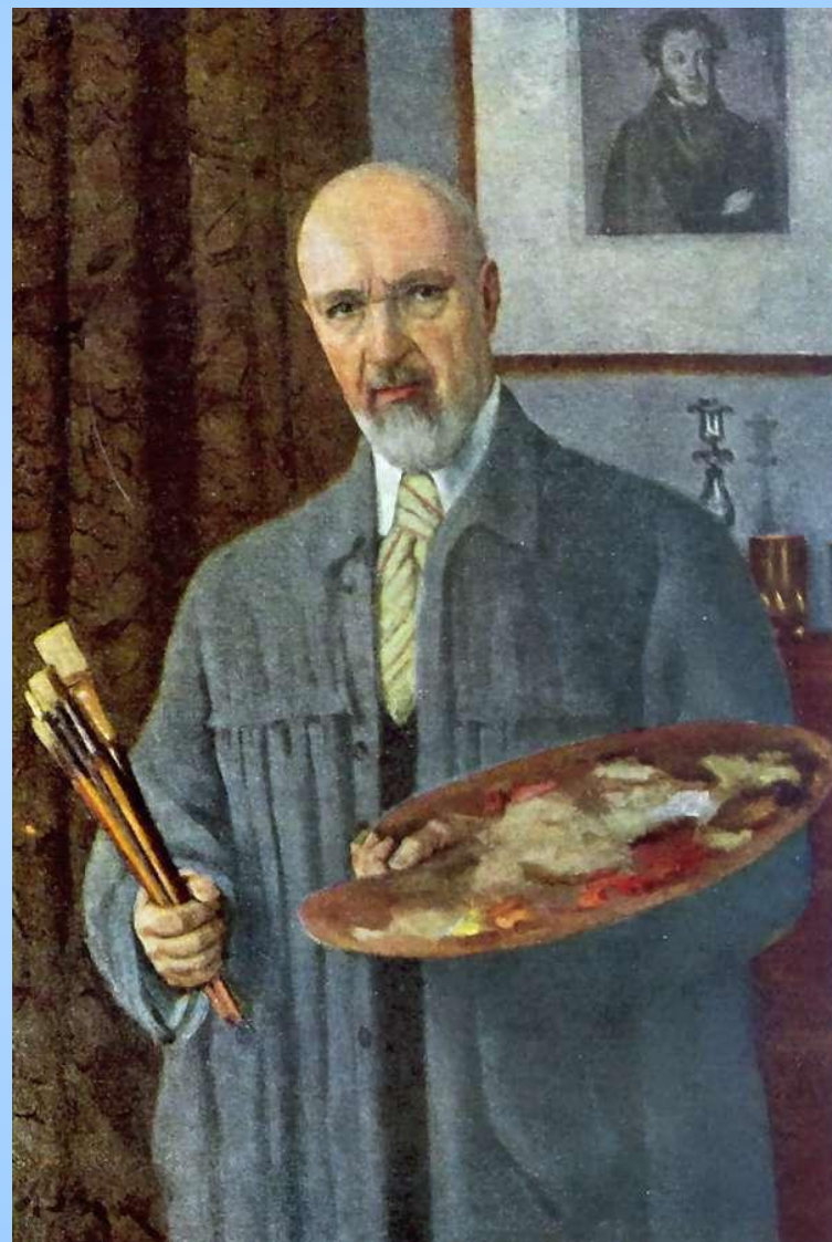
Автопортрет. 1953 г.

■ К. Ф. Юон умер 11 апреля 1958 года. Похоронен в Москве на Новодевичьем кладбище.