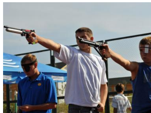
стрельба из пистолета