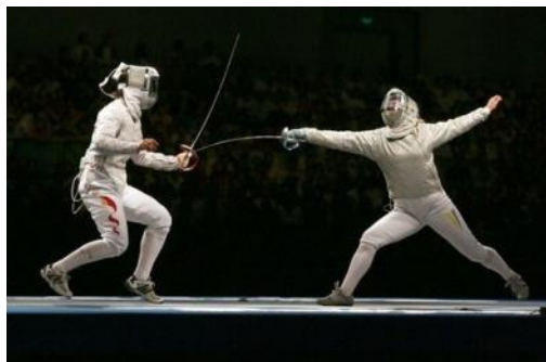
фехтование на шпагах