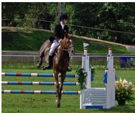
верховая езда с препятствиями