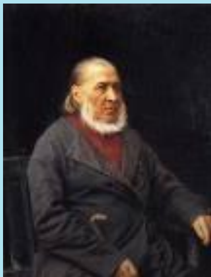
Портрет С.Т. Аксакова работы И. Крамского 1878 г.