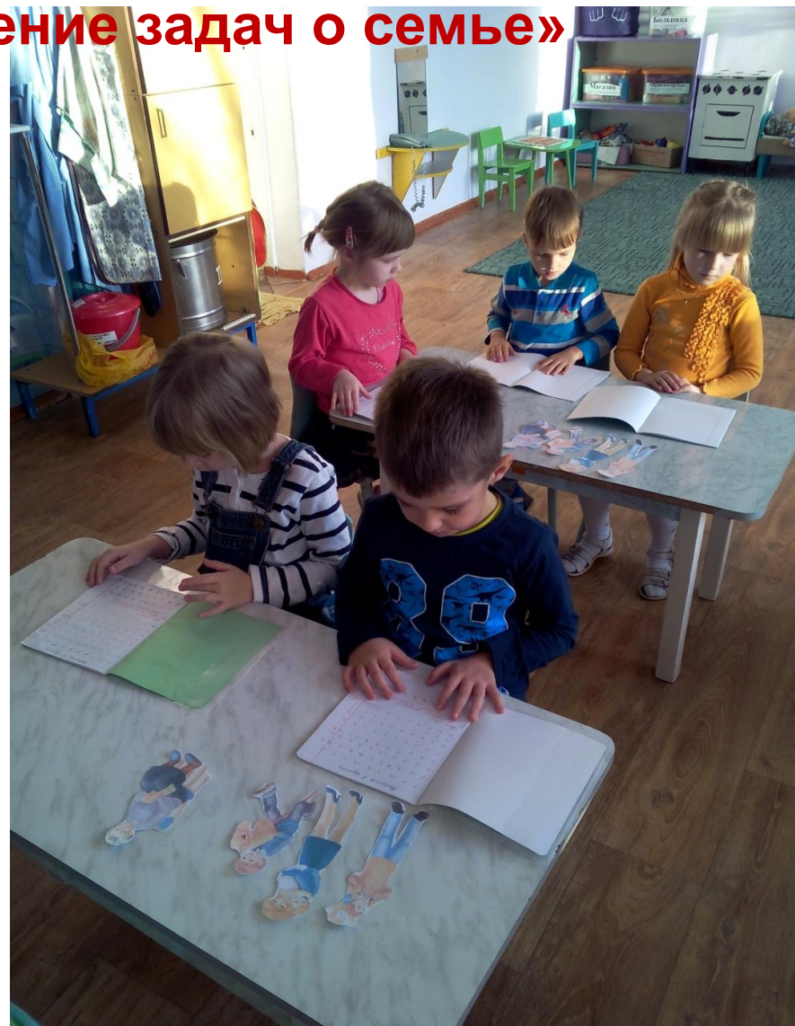
Работа в тетрадях