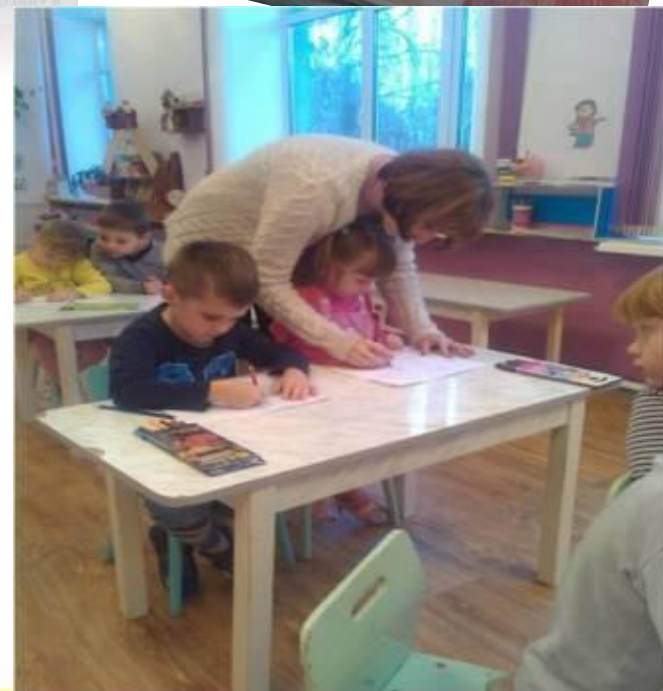
Рисование «Портрет моей семьи»