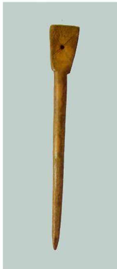
Писало Кость, резьба Длина 14 см. XI в.