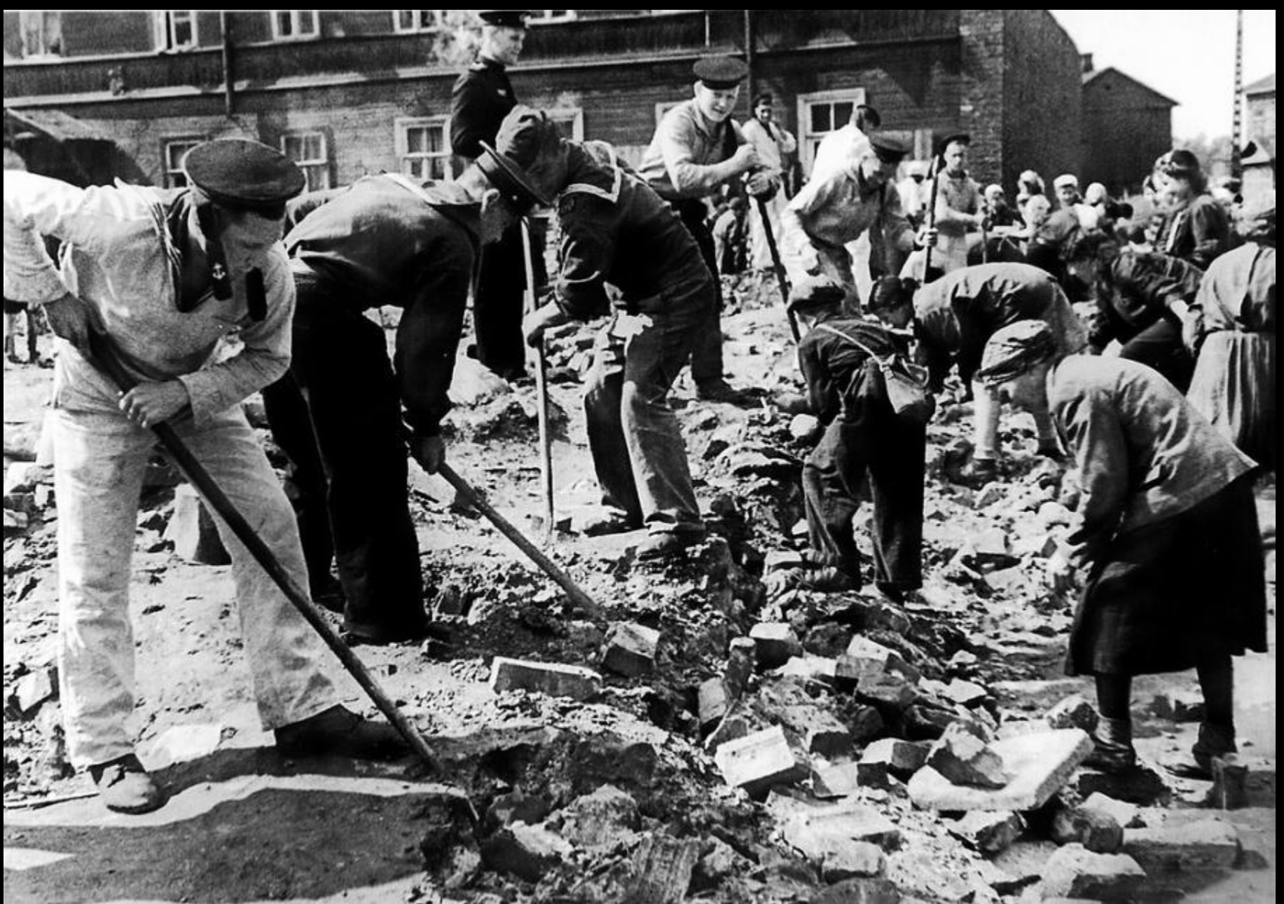
Моряки-балтийцы и работники Главпочтамта на воскреснике по разборке разрушенных ленинградских зданий. Июль 1943 г.