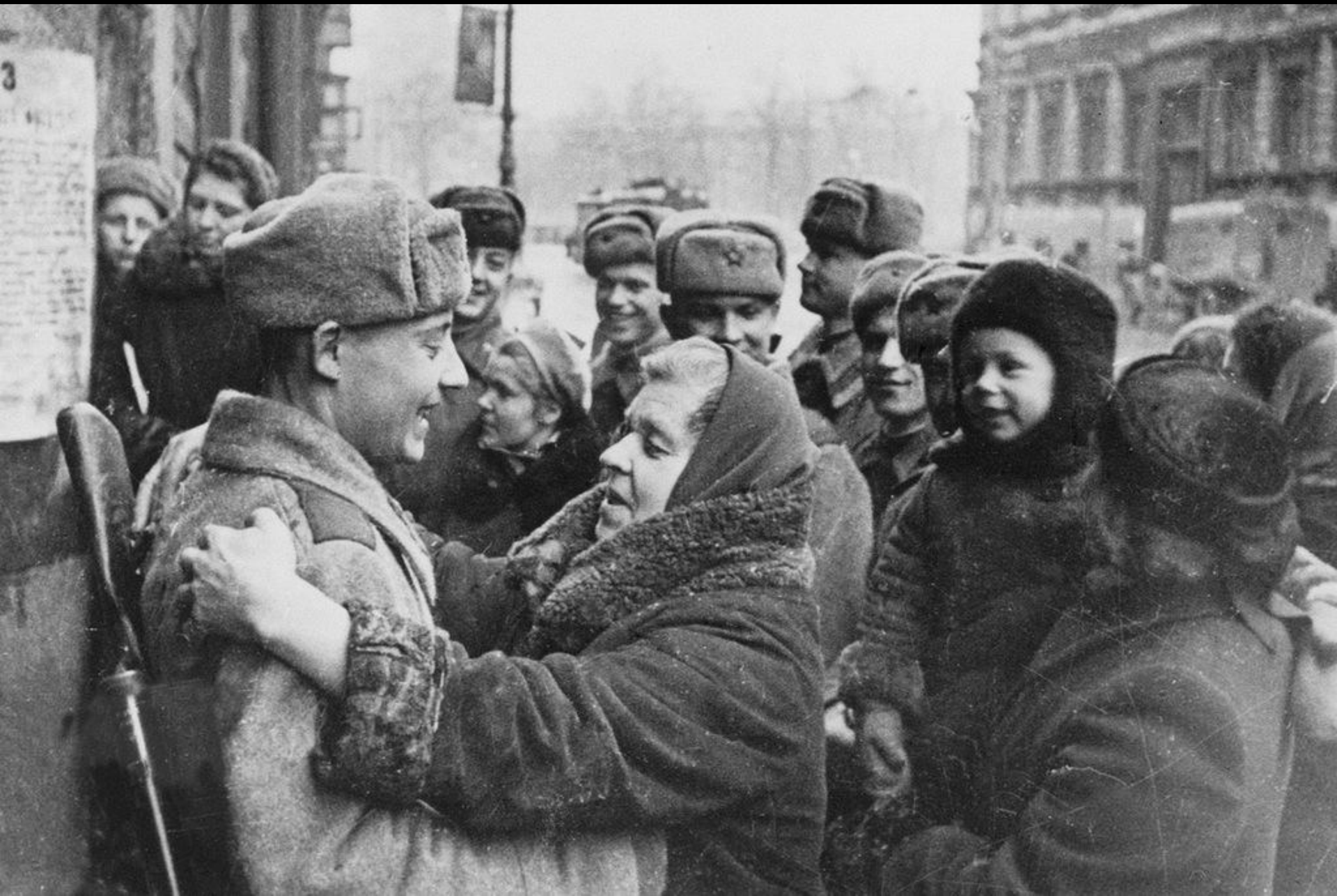
Ленинградцы и красноармейцы у приказа войскам Ленинградского фронта о снятии блокады города. Январь 1944 г.