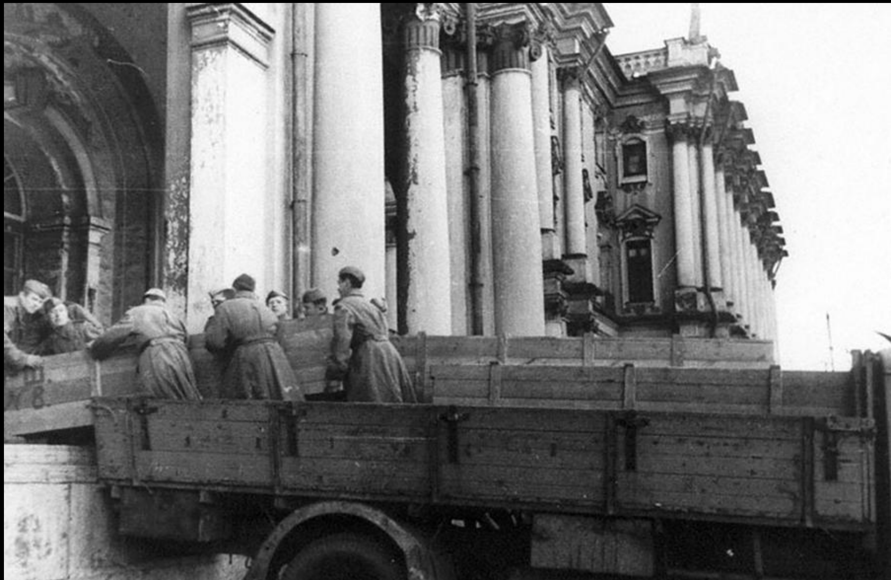
Солдаты разгружают ящики с экспонатами Государственного Эрмитажа, возвращенными из эвакуации в г.Свердловск. 1945 г.