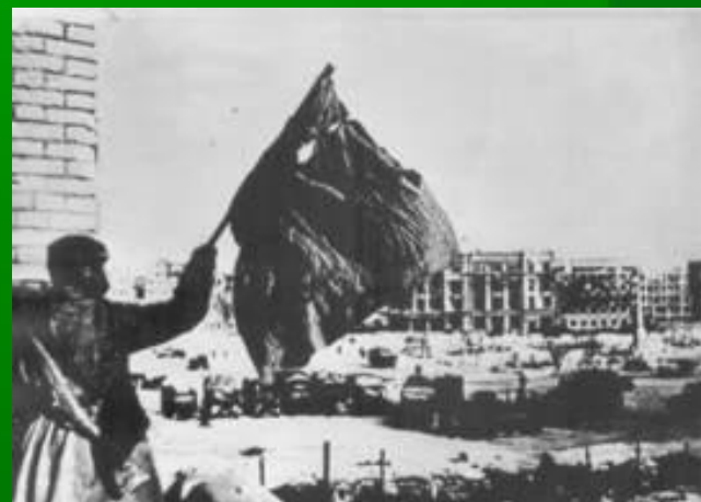
Знамя Победы в Сталинграде