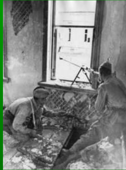
Бронебойщики ведут огонь по танкам вермахта