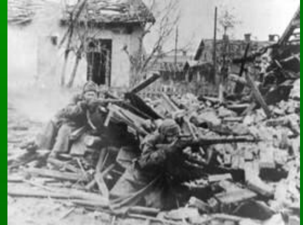
Бои на окраинах