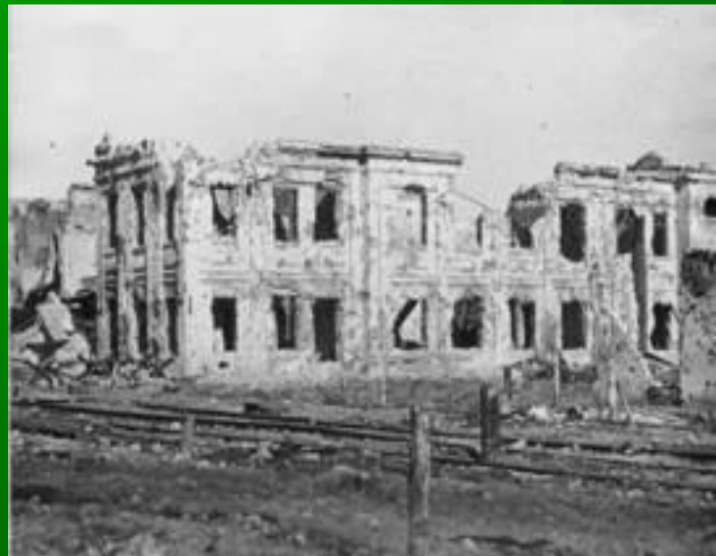
Руины на месте жилых домов