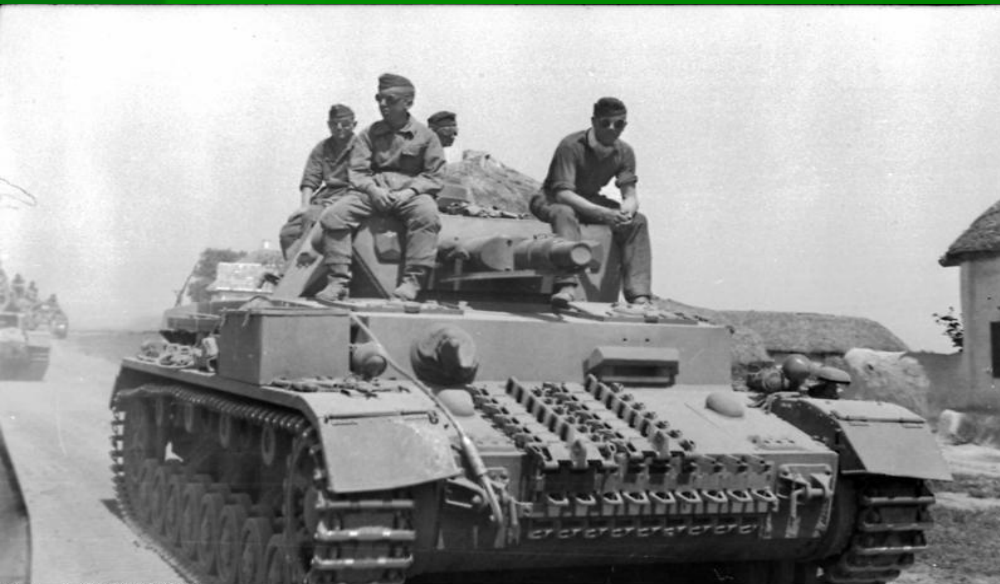
1. Juni 1942

...У тебя нет сердца и нервов, на войне они не нужны. Уничтожь в себе жалость и сострадание, убивай всякого русского, не останавливайся, если перед тобой старик или женщина, девочка или мальчик. Убивай, этим самым спасешь себя от гибели, обеспечишь будущее своей семьи и прославишься навек.