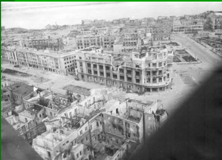
Панорама разрушенного Сталинграда