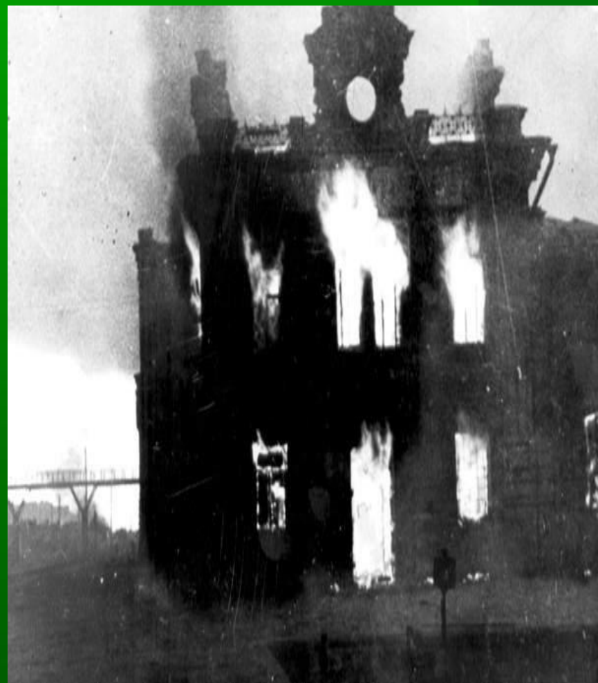
Горит Сталинградский железнодорожный вокзал