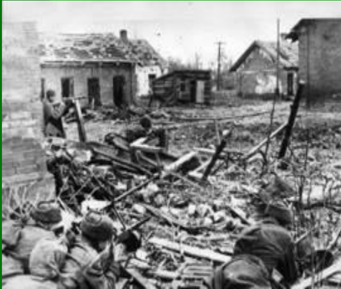
В ожидании атаки