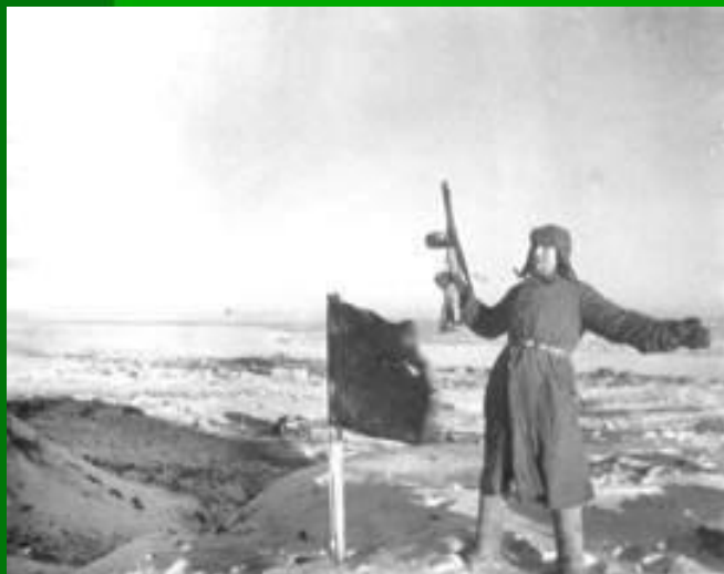
Победный флаг на вершине Мамаева кургана