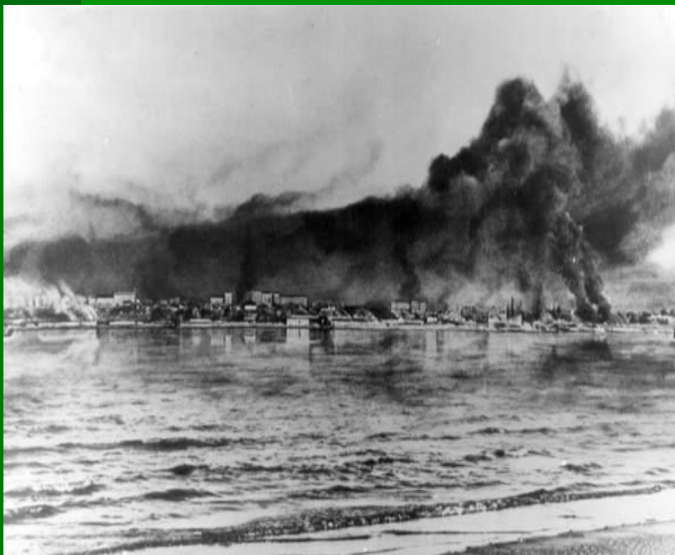
Сталинград и Волга в огне