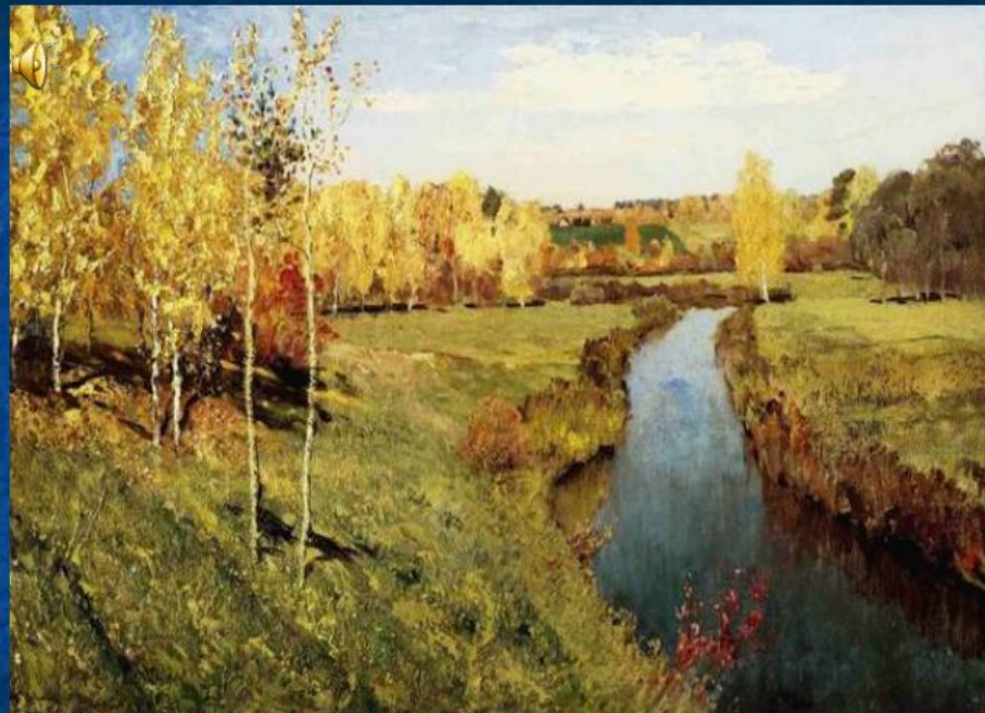
И.Левитан «Золотая осень»