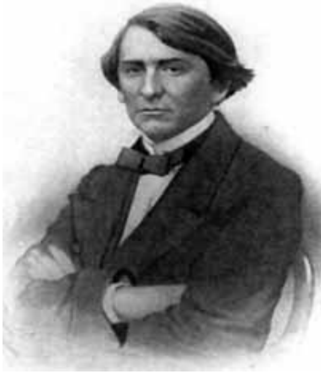
Алексей Николаевич Плещев (1825-1893 )

Миновало лето, Осень наступила. На полях и в рощах пусто и уныло.