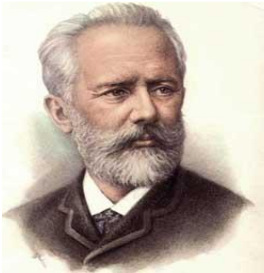
Петр Ильич Чайковский (1840-1893)

Цикл «Времена года» 12 месяцев - 12 пьес