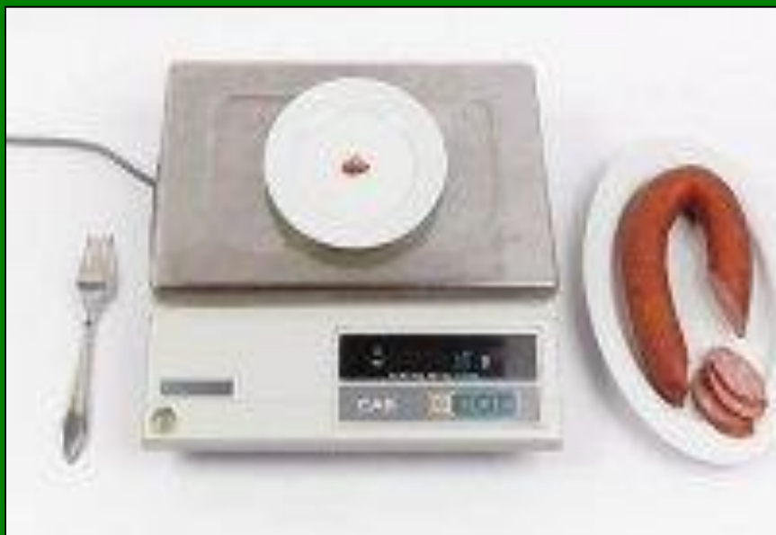
Рис - 10 г