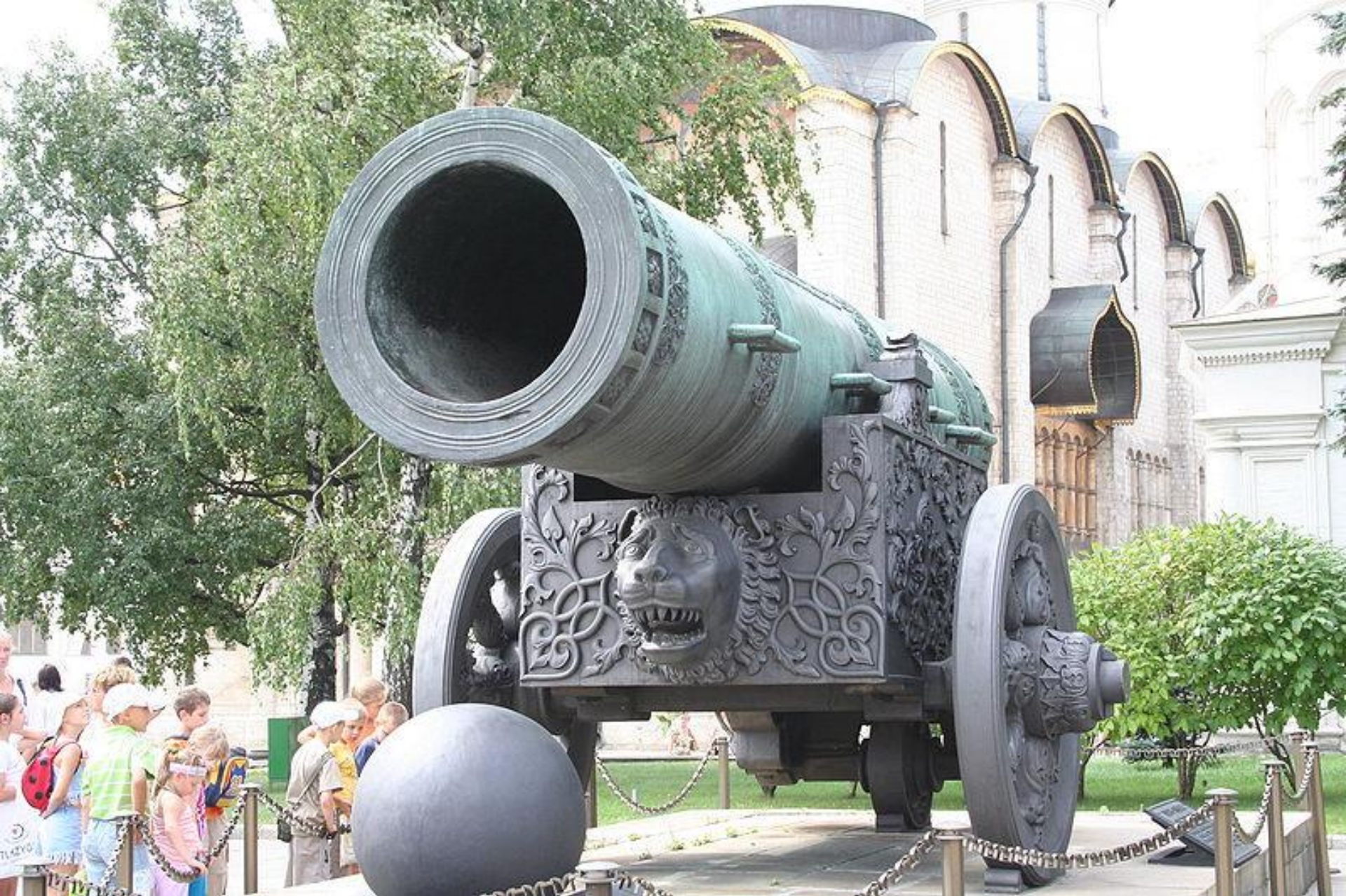
Царь – пушка г. Москва