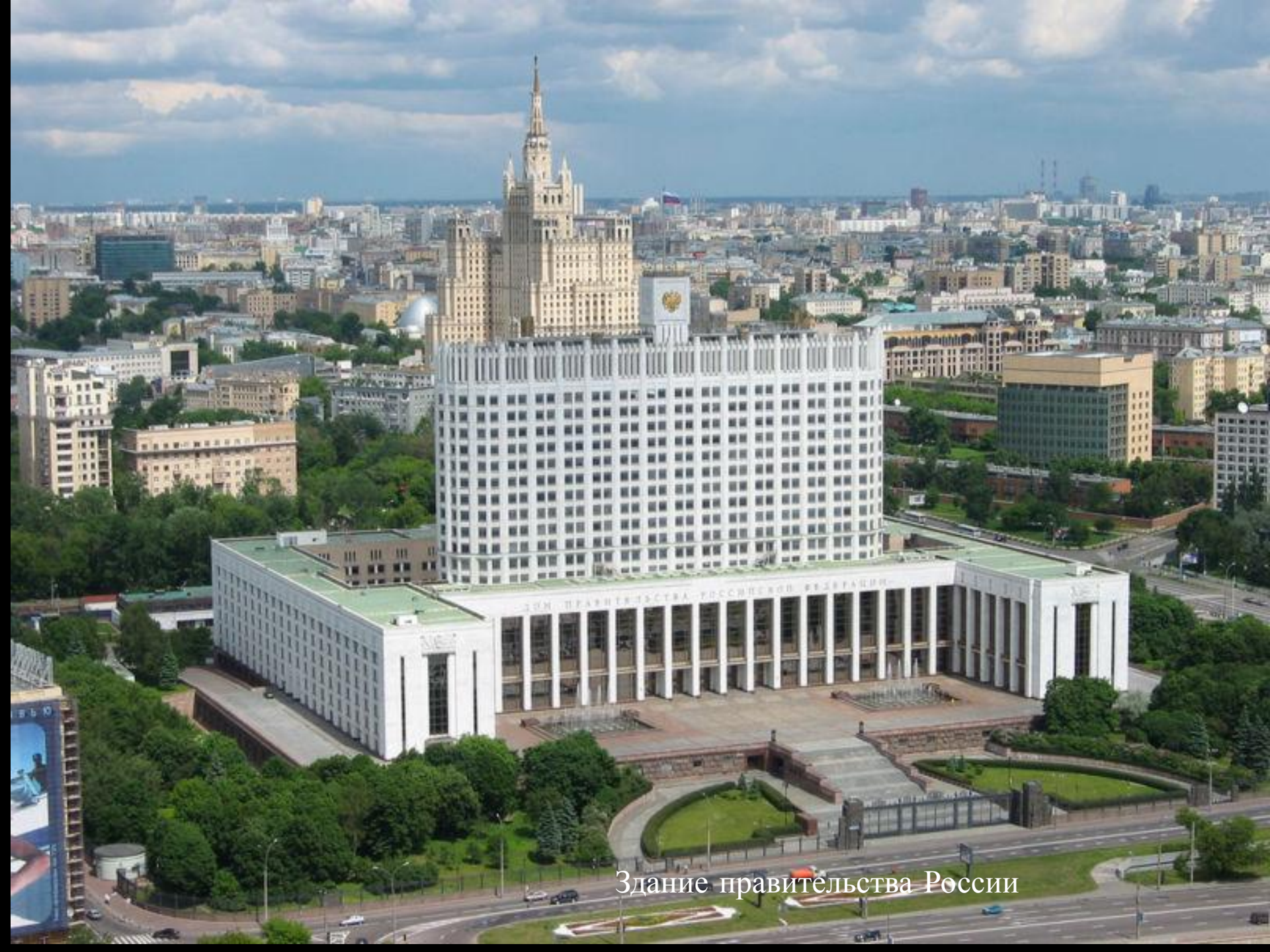
Здание правительства России