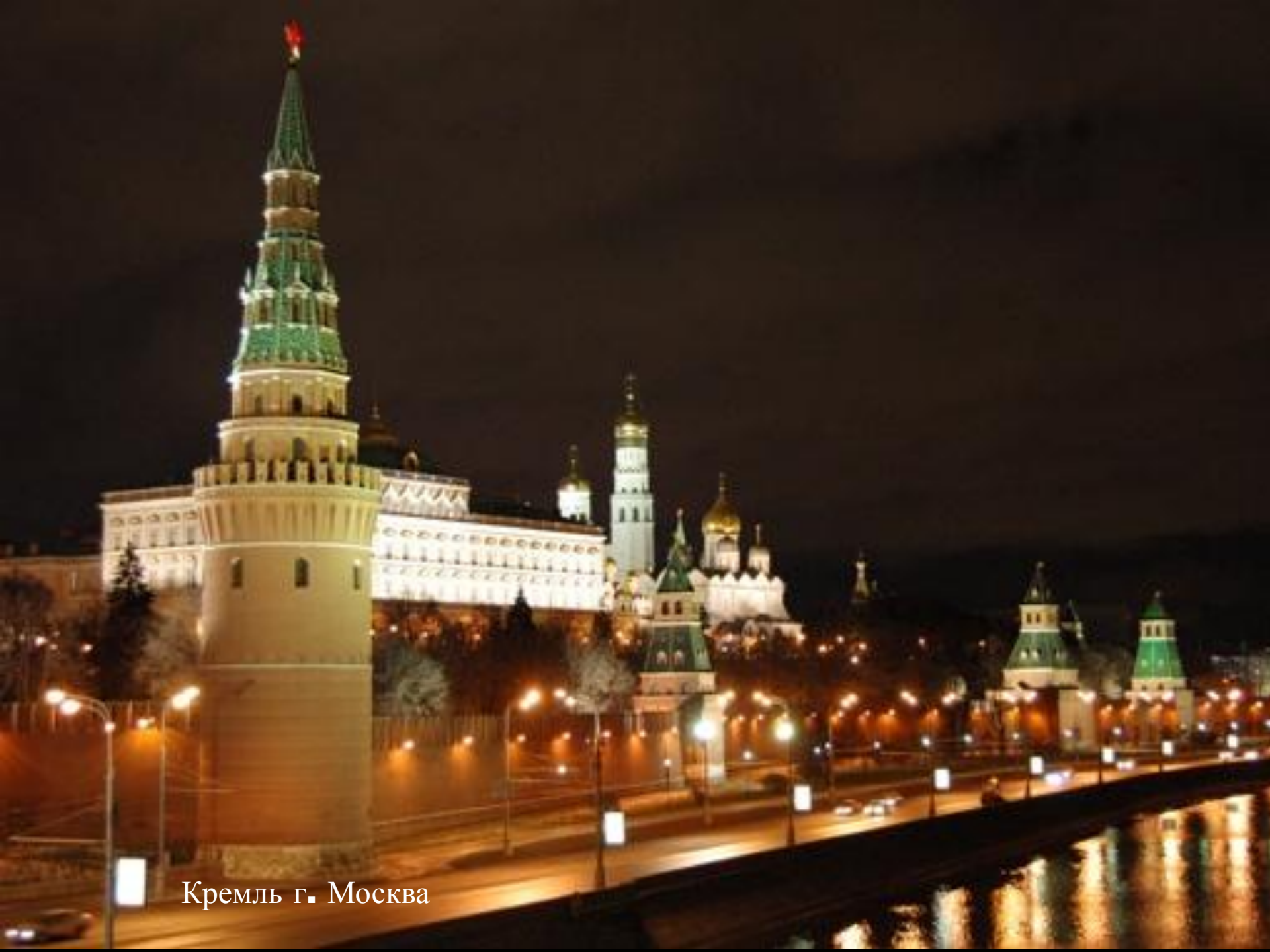
Кремль г. Москва