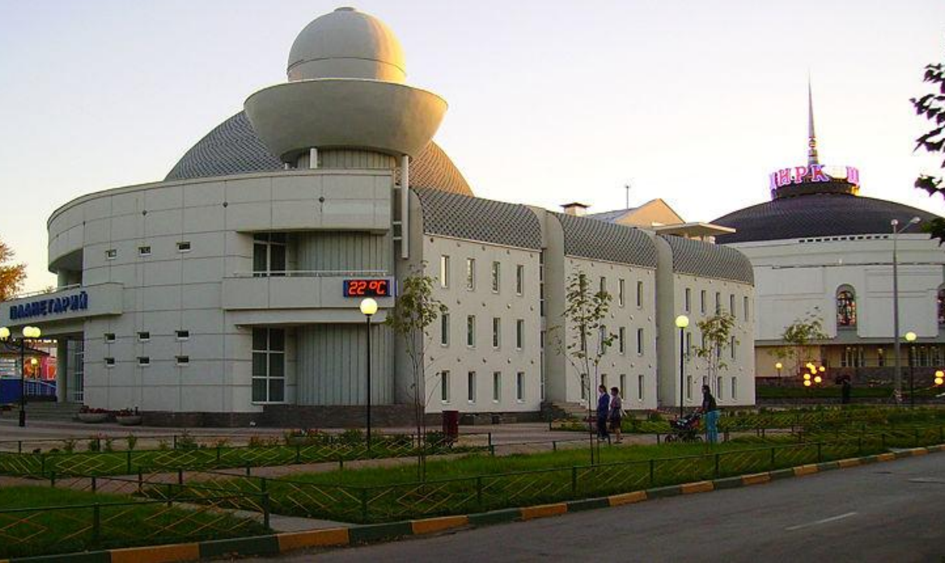
Здания планетария и цирка