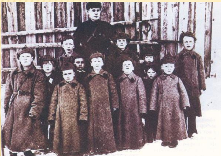
Дети-заключенные с воспитателем. 1932 г.