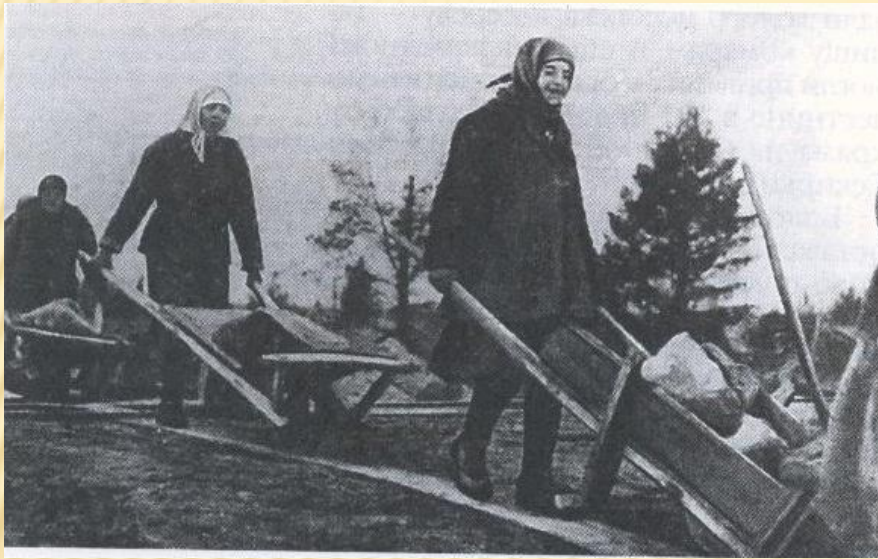
Женщины-заклученные, первозящие на тачках обломки скал. 1933 г.