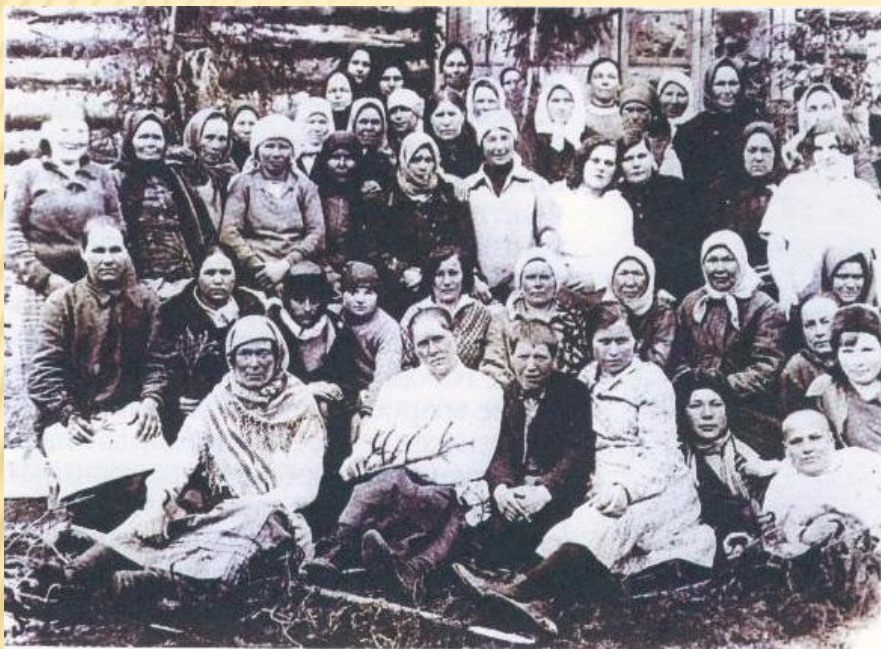
Группа женщин-заключенных исправительно-трудового лагеря 1932 г.