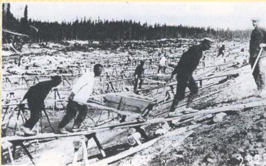
Заключенные перевозят камни на постройке Беломорканала. 1932 г.