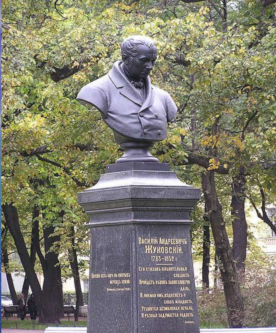
Памятник Жуковскому в Александровском саду