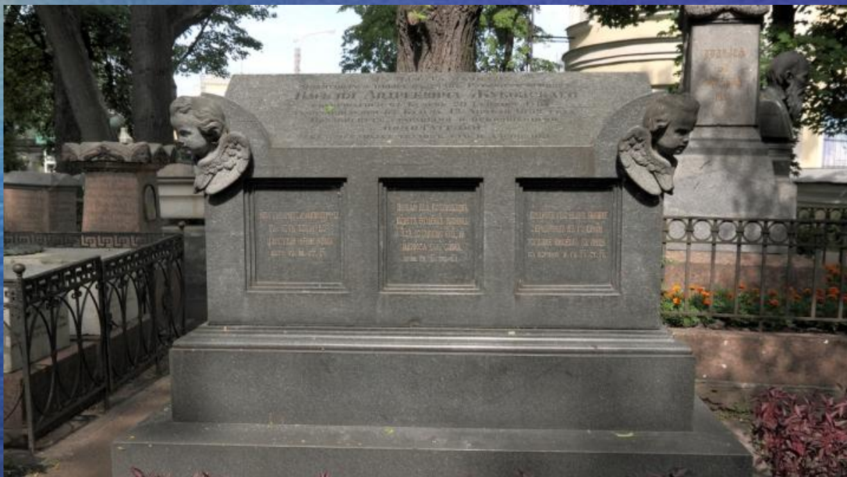
Некрополь Александро-Невской лавры. Надгробие на могиле В.А.Жуковского.

И он вернулся: 29 августа он был похоронен в Санкт-Петербурге на кладбище Александро-Невской Лавры, рядом с Н.М.Карамзиным.