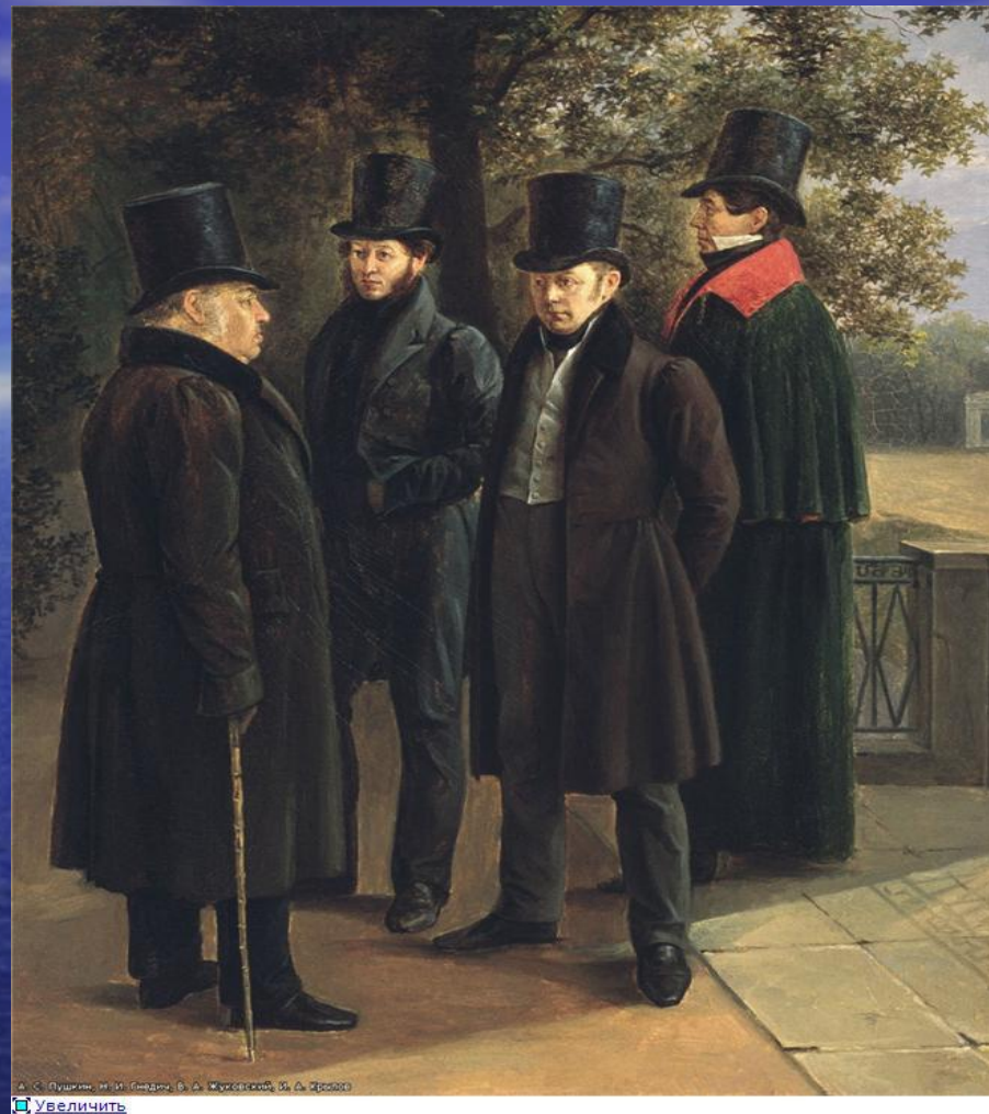
Крылов, Пушкин, Жуковский, Гнедич в Летнем саду

Если окинуть взглядом даль русской поэзии, то среди немногих всегда заметных ее творцов будет возвышаться Василий Андреевич Жуковский, учитель Пушкина и сам великий русский поэт. Пушкин – солнце, Жуковский – вечерняя звезда первой величины, причем звезда глубокого живого мерцания. Василий Андреевич в 1820 году подарил Пушкину портрет с известной надписью: «Победителю – ученику от побежденного учителя...»